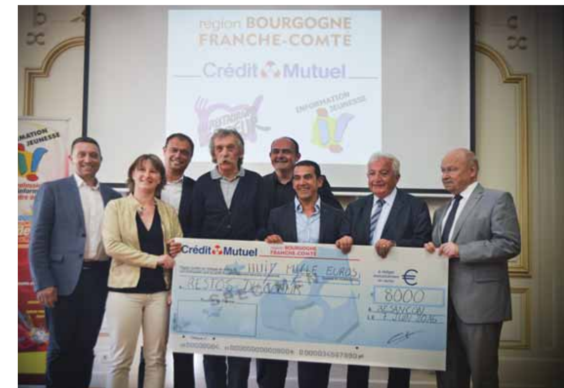
Les représentants de la Région Bourgogne-Franche-Comté, du Crédit Mutuel, des Restos du cœur et du Centre régional d'information jeunesse de Franche-Comté, lors de la remise du chèque en faveur de l'association caritative, le 7 juin dernier.

(1) Jeux, jouets, équipement bébé, soins du corps, vêtement