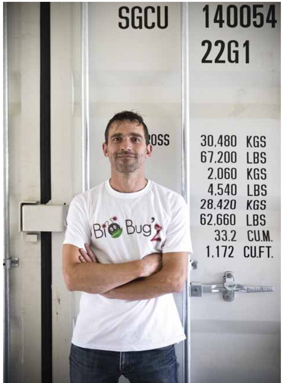
En savoir plus, ffpidi.org , Agri bug'z , 06 30 92 08 99, biobugz.fr

tains insectes auraient des propriétés étonnantes comme celle de consommer le plastique... » En tenant compte du respect des normes, le nombre d'éleveurs en France serait de moins d'une dizaine. « Il existe une demande croissante pour laquelle il reste à organiser une filière en France. D'autres pays comme la Hollande sont plus avancés. Il nous faut communiquer, montrer que l'on est sérieux et que l'on construit une filière propre ». Pour cette raison, il prend son temps et commence son élevage avec un seul type d'insecte, estimant pouvoir atteindre une production de 40 tonnes d'ici 5 ans.