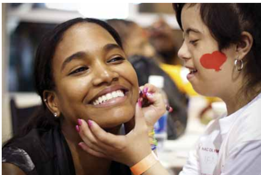
Accompagnement des personnes handicapées, préparation au secourisme : le Crédit Mutuel aide les jeunes qui s'impliquent.

(1) Offre valable une fois. Somme non cumulable, versée sur un compte ouvert au Crédit Mutuel à tout jeune de moins de 26 ans qui s'engage dans des actions d'entraide, dans des missions humanitaires, dans l'enseignement de pratiques sportives... La prime sera versée pour un engagement pris dans l'année. Sous réserve d'acceptation par la Caisse de Crédit Mutuel et de respect des valeurs du Crédit Mutuel.