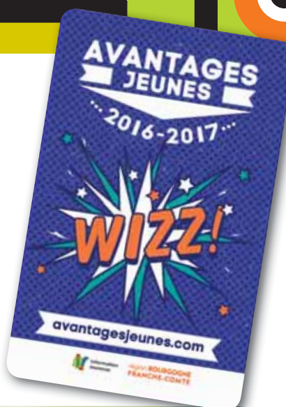
Visuel de la carte édition 2016-2017.