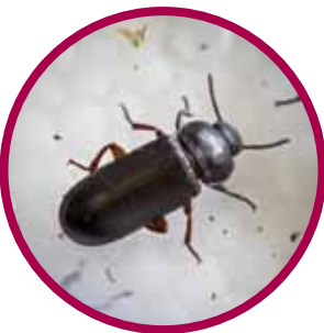
Le ténébrion meunier.