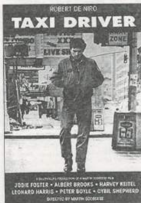
Paul Schrader a notamment écrit le scénario de «Taxi driver». Le chef d'oeuvre de Scorsese est au programme d'«Entrevues».

POUR les cinéphiles, Entrevues permet de découvrir nombre de films et documentaires contemporains de tous horizons. A la sélection officielle de premières et secondes oeuvres s'ajoutent une série de cycles prétextes à balayer l'histoire du 7 e art. Une place particulière est accordée cette année à Ornella Muti avec entre autres la trilogie parallèle de Lucas Belvaux («Un couple épatant», «Cavale», «Après la vie») mais aussi «le Futur est femme», «Conte de la folie ordinaire» et «la Dernière femme» de Marco Ferreri, «les Nouveaux monstres» de Dino Risi, etc. L'intégralité des films de Paul Schrader, cinéaste obsédé par la thématique de la rédemption, sera projetée : parmi les plus connus, «American gigolo», «la Féline», «Affliction». Cycle complet puisque le public pourra également voir les films scénarisés par Schrader : «The Mosquito Coast» de Peter Weir, «Obsession» de Brian de Palma ou encore le cultissime «Taxi Driver» de Martin Scorsese et bien d'autres.