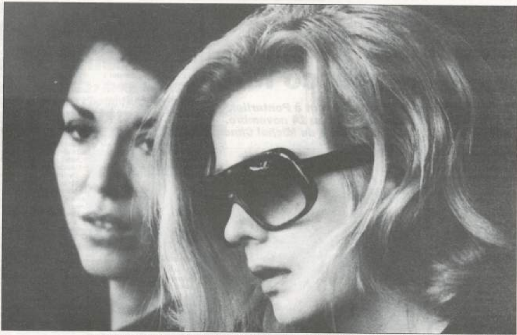
Gena Rowlands dans « Opening night ». Magnifique film de Cassavetes à voir au cours du festival Entrevues 2004 (Belfort, du 27/11 au 5/12).