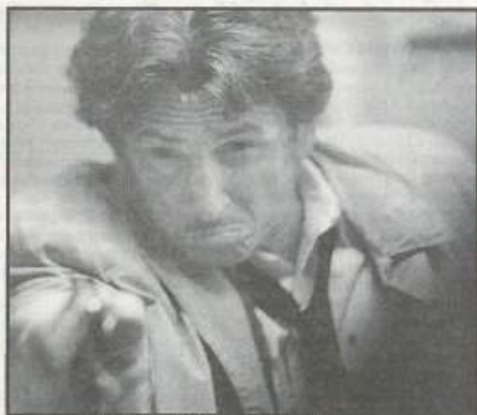
Sean Penn, « the Assassination of Richard Nixon ».

Mais les 3 bons à 3 euros ne sont pas uniquement utilisables pour les sorties du 3 novembre. Suivant les programmations des cinés partenaires, il est aussi possible de les utiliser pour les films encore à l'affiche : Audrey Tautou dans le « Long dimanche de fiançailles » de Jean-Pierre Jeunet, la science-fiction « Alien vs Predator » (Paul Anderson aux commandes), Sean Penn dans « the Assassination of Richard Nixon (Nils Mueller), Kirsten Dunst dirigée par Richard