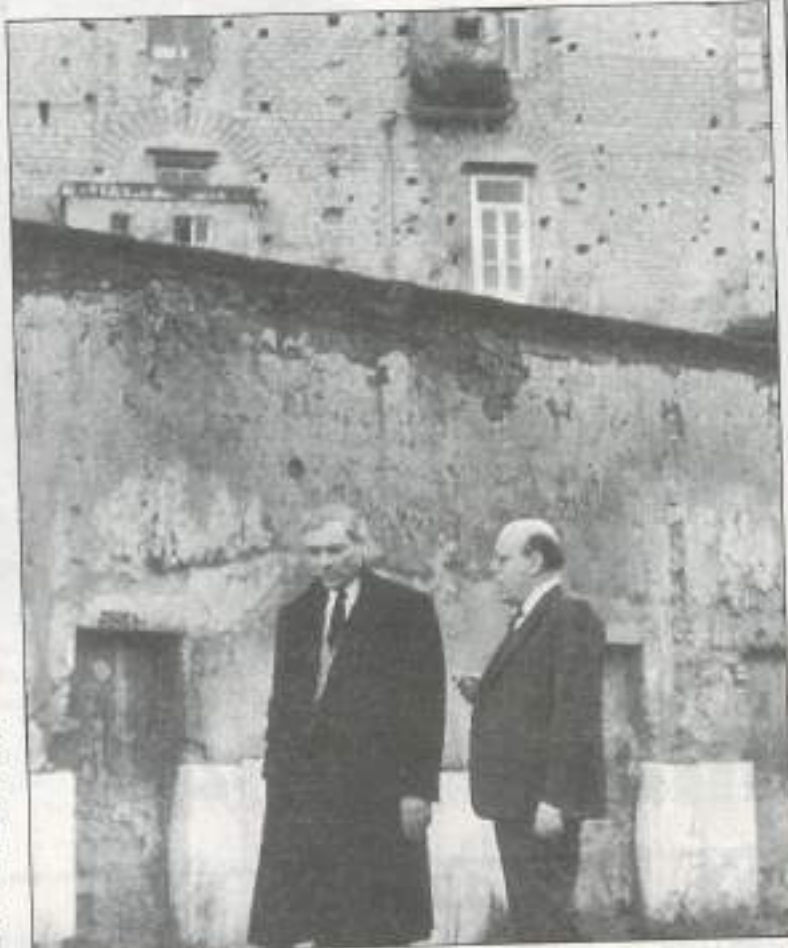
« Lucky Luciano », 1973.