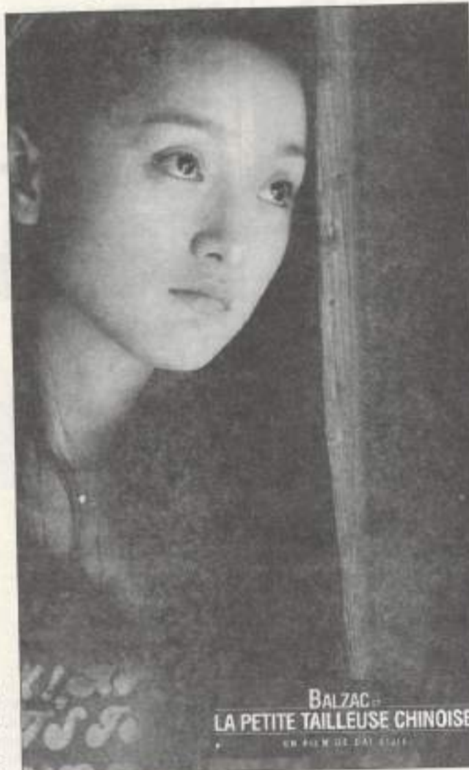
BALZAC LA PETITE TAILLEUSE CHINOISE EN FILM DE DAI SIIJE

: Voyage au Tadjikistan avec Hamro, petite frappe moscovite de retour dans son petit village tadjik. Troisième film d'un réalisateur qui fut aussi acteur chez Omirbaev et qui mêle habilement à son intrigue des éléments quasi documentaire de la vie quotidienne de son pays. Le 24 à 18 h et le 25 à 21 h.