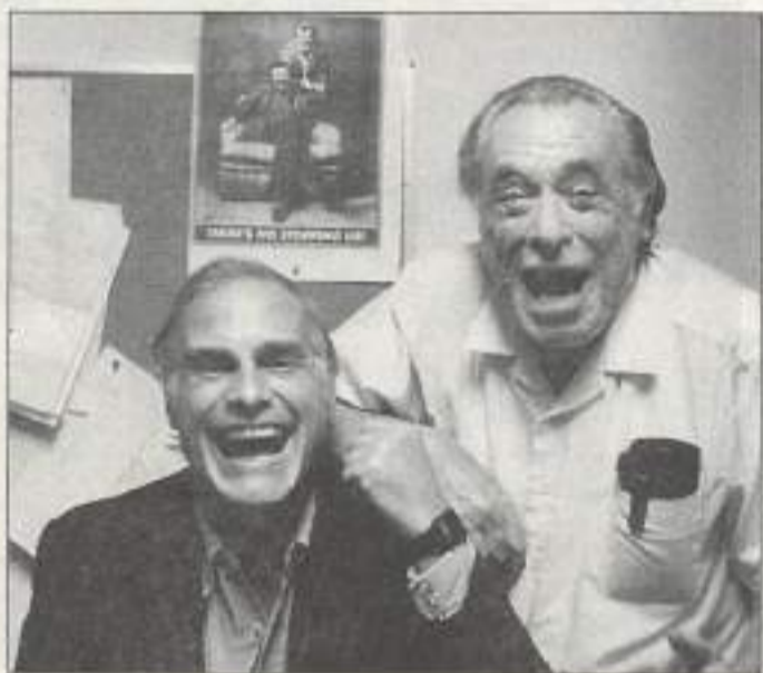
Barbet Schroeder (à g.), avec Charles Bukowski

A PRES l'obsessionnel Michael Cimino l'an dernier, c'est à un réalisateur un peu à l'opposé que le festival Entrevues 2003 donne un coup de chapeau : Barbet Schroeder est en effet responsable d'une œuvre d'une extrême diversité de ton. Sa filmographie de 30 ans a donné lieu à des œuvres empruntant plus ou moins le ton du documentaire («Général Idi Amin Dada», «La Vierge des tueurs»), au coup de sonde dans une époque («More»), au fait divers romancé («Le Mystère Von Bülow») ou à la fiction pure et dure («Barfly» encore qu'inspiré de Charles Bukowski, le thriller «Jeune fille cherche appartement»). En sa présence, l'édition 2003 d'Entrevues présentera l'intégrale de ses œuvres. Présence également de Stéphane Audran, premier et second rôle de multiples films français depuis les années 60 et égérie de Claude Chabrol («les Biches», «les Bonnes femmes», «le Boucher...») à qui sera donné l'autre coup de chapeau du festival. A ces deux artistes particulièrement mis en avant s'ajoutent les habituelles rubriques : - panorama sur la Chine avec une présentation de l'œuvre naissante du cinéaste Jia Zhang-Ke et panorama de Hong Kong depuis 1997.