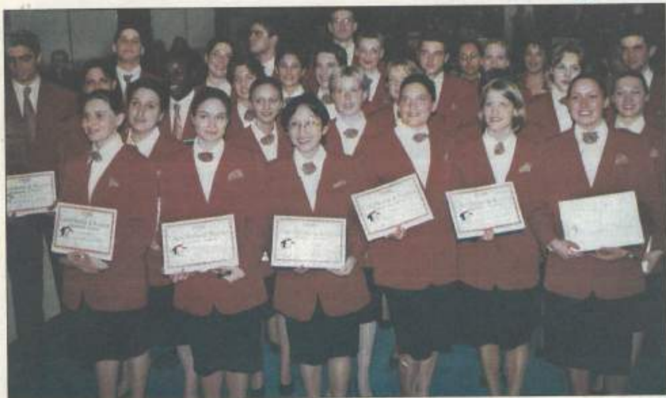
Cours hôtelier de Besançon, promotion 2002-2003