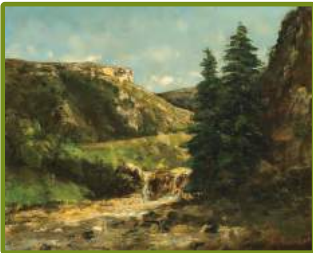
Paysage des environs d'Ornans (collection permanente du musée Courbet).