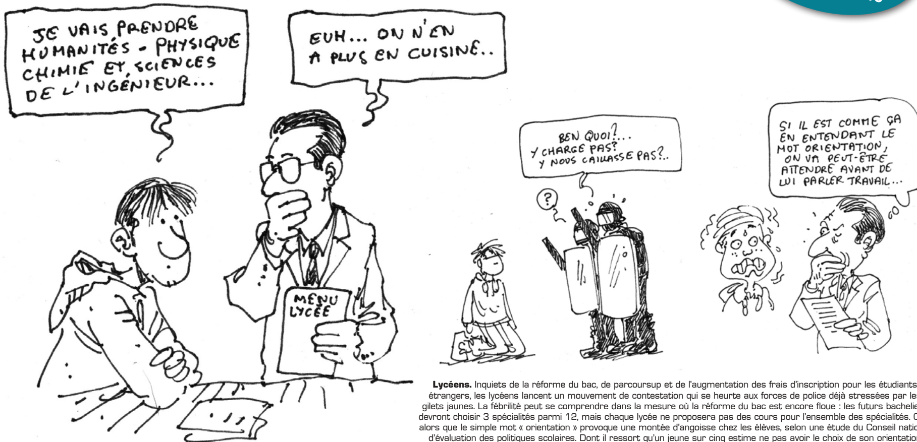
Lycéens. Inquiets de la réforme du bac, de parcoursup et de l'augmentation des frais d'inscription pour les étudiants étrangers, les lycéens lancent un mouvement de contestation qui se heurte aux forces de police déjà stressées par les gilets jaunes. La fébrilité peut se comprendre dans la mesure où la réforme du bac est encore floue : les futurs bacheliers devront choisir 3 spécialités parmi 12, mais chaque lycée ne proposera pas des cours pour l'ensemble des spécialités. Cela alors que le simple mot « orientation » provoque une montée d'angoisse chez les élèves, selon une étude du Conseil national d'évaluation des politiques scolaires. Dont il ressort qu'un jeune sur cinq estime ne pas avoir le choix de son orientation scolaire et qu'un sur deux est satisfait de l'accompagnement à l'orientation au cours du lycée.

Chaque jour un dessin sur facebook.com/topofc et topo-bfc.info