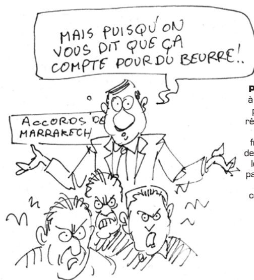
Pacte de Marrakech. Ce texte destiné à renforcer la coopération internationale pour une «migration sûre, ordonnée et régulière» réussit à soulever les critiques et des partisans de la fermeture des frontières et des défenseurs des droits de l'Homme. Les uns trouvent qu'il va trop loin, les autres pas assez. Ils n'auraient pas ou mal lu le texte selon le secrétaire général de l'ONU, Antonio Guterres, confortés par les rumeurs infondées qui affluent dès la signature du texte.