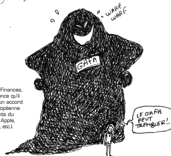
Gafa. Le ministre des Finances, Bruno Le Maire, annonce qu'il ne veut plus attendre un accord au sein de l'Union européenne pour taxer les géants du numérique (Google, Apple, Facebook, Amazon, etc.).