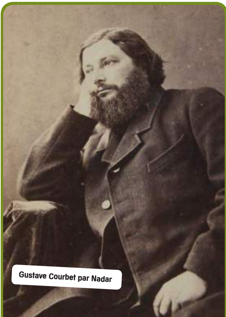
Gustave Courbet par Nadar

Le peintre est né à Ornans le 10 juin 1819. Le Département du Doubs lui rend hommage à travers une centaine de projets artistiques et festifs. De la peinture, mais aussi de la musique, du théâtre ou du sport !