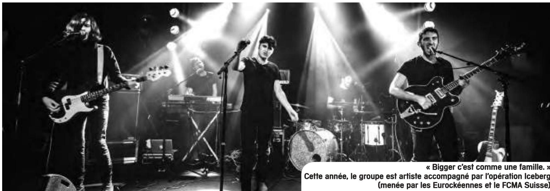
« Bigger c'est comme une famille. » Cette année, le groupe est artiste accompagné par l'opération Iceberg (menée par les Eurockéennes et le FCMA Suisse)