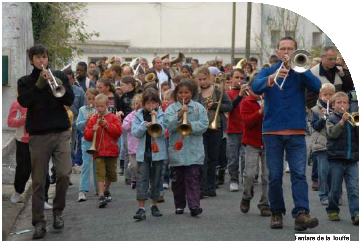
Fanfare de la Touffe

uel est le point commun entre Stromae, Orelsan, Jeanne Added, ou encore Eddy de Pretto ? La talent, bien sûr, mais aussi d'être passé par GéNéRiQ. Un festival qui défriche et qui palpite au cœur de la ville, s'invitant en pleines rues afin d'y faire régner un vacarme des plus harmonieux. La douzième édition aura lieu du 7 au 10 février 2019. Des plus pointus aux plus populaires, une grande variété de styles de musiques résonnera entre les murs de cinq villes de Bourgogne-Franche-Comté et d'Alsace, de Dijon à Mulhouse, de Besançon à Belfort en passant par Montbéliard. Partout des artistes, des orchestres originaux, une armada de musiciens estampillés 100 % GéNéRiQ vont fondre sur la ville et s'en emparer. Des briscards qui n'ont plus rien à prouver comme Arnaud Rebotini, l'homme le plus classe de l'électro française ou des bonnes copines comme Anna Calvi et Ann O'aro. Mais aussi des petits nouveaux dans la clique à l'image des Death Valley Girls, des Irlandais de Fontaines D.C. ou de Bodega. Mario Batkovic va lui jouer une création spéciale pour le festival dans toutes les villes accompagné de son accordéon, de son pote le grand Reverend Beat-man et de quatre contre-bassistes recrutés dans la région.