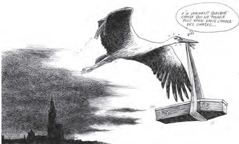
Attentat. Le 11 décembre, Chérif Chekatt tue 5 personnes et en blesse 10 autres lors d'une fusillade dans le centre de Strasbourg. Il est abattu par une patrouille de police après deux jours de traque.