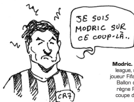
Modric. Déjà élu meilleur joueur de la Champion's league, meilleur joueur de la coupe du monde et joueur Fifa de l'année, le Croate Luka Modric devient Ballon d'or de football, mettant fin à 10 ans de règne Ronaldo/Messi, juste avant de gagner la coupe du monde des clubs avec le Real Madrid.