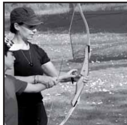
Animations Vital'sports à Besançon, pendant les vacances de Pâques. Le métier d'éducateur ou d'animateur sportif doit tenir compte de variations saisonnières importantes. Le groupement d'employeurs et l'annualisation du temps de travail sont des moyens de pallier ce morcellement.