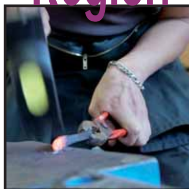
Journées de l'apprentissage