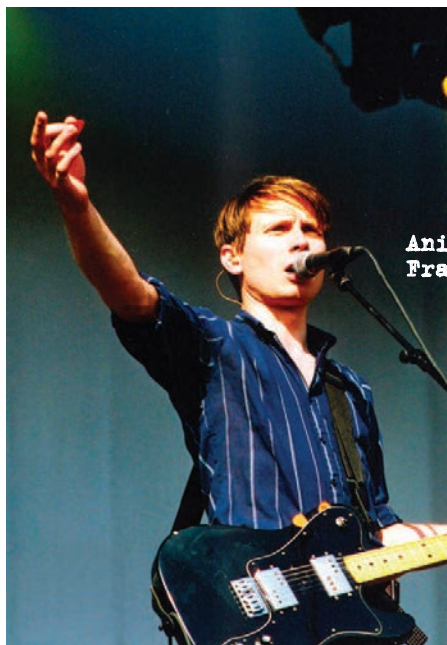
Animateurs d'été... Depeche Mode, Deftones, Franz Ferdinand, Arctic Monkeys.