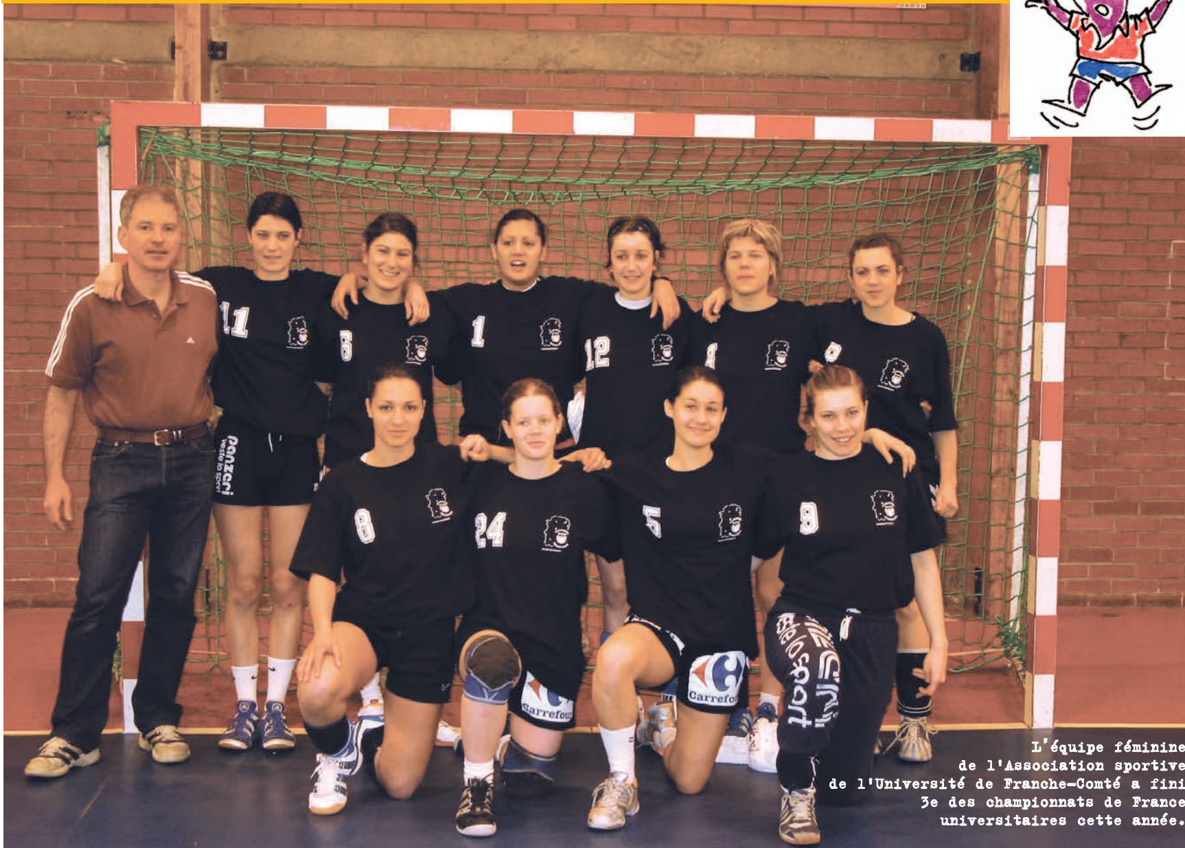
L'équipe féminine de l'Association sportive de l'Université de Franche-Comté a fini 3e des championnats de France universitaires cette année.

L e Comité régional de sport universitaire de Franche-Comté organise du 26 juin au 1er juillet à Besançon les premiers championnats d'Europe universitaires de handball. La compétition rassemble quelques-unes des meilleures équipes universitaires de hand championnes dans leur pays. Chez les garçons, 12 équipes devraient se disputer ce