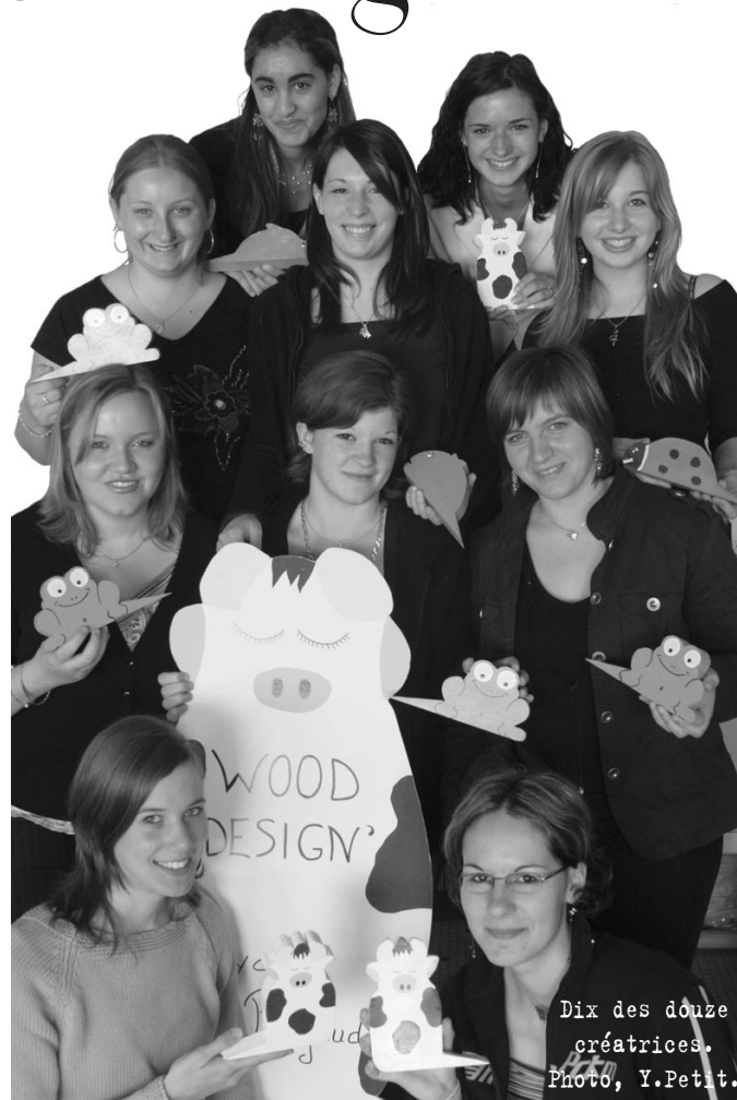
Dix des douze créatrices.

Et les élèves ont pu approcher ce que représente une entreprise. "Cela demande de bonnes connaissances en compta, c'est dur à gérer, on pensait que c'était plus simple" disent-elles. Même s'il s'avère des souhaits d'orientation des jeunes filles participantes que peu d'entre elles sont concernées à court terme : BTS assistant de direction, BTS secrétariat trilingue, CAP esthétique, fac AES, fac de psycho ou école d'infirmière... Mais elles auront pu évaluer les nécessités et les aléas de l'entreprise, travailler en équipe, gérer un