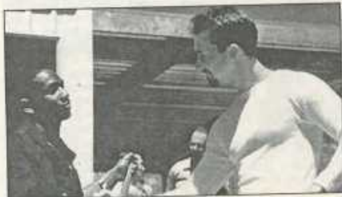
• American history X • de Tony Kaye (99) sera projeté le 27 mars.

Le rapport annuel sur le racisme et la xénophobie de la commission nationale consultative des droits de l'Homme fait, cette année, le constat suivant : 69% des Français se déclarent plus ou moins racistes (et 29 % pas racistes du tout en recul de 7 points par rapport à l'année dernière). Le plus inquiétant réside d'après les spécialistes des droits de l'Homme dans le fait que le racisme devient un sujet moins tabou. Les partis à tendance xénophobes atteignent des niveaux de scrutin élevé, les problèmes d'immigration deviennent de plus en plus sensibles dans les pays de la Communauté européenne. Pour réagir en menant les actions de sensibilisation en direction de toute la population et notamment vers les jeunes, le Bureau Information Jeunesse Lure et ses partenaires financiers et techniques ont décidé de reconduire la campagne d'éducation contre le racisme et l'intolérance à Lure. Cette campagne s'adresse à tous de 7 à 77 ans. Les plus jeunes seront interpellés à travers un spectacle de