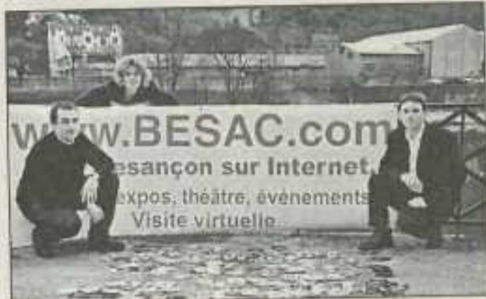
Les créateurs du site.

Les 2500 connexions par mois en début d'année ont déjà doublé passant à 5000 en mars. Site Internet essentiellement culturel, www.besac.com est né en avril 99, dans l'idée d'être une sorte de complément au site officiel de la Ville de Besançon. Lancé par l'entreprise Web confiance, il a pour attrait premier de proposer le calendrier des événements culturels et de loisirs de Besançon et alentour, actualisé quotidiennement (concerts, expos, théâtre, bars, cinés...). Possibilité est laissée aux organisateurs d'événements en tous genres de les annoncer gratuitement, à l'aide d'un formulaire adéquat. Cependant, autour de ce calendrier établissant deux mois de rendez-vous, le site propose également un éventail de prestations autour de Besançon : des petites annonces gratuites, dont certaines d'appartements à visiter virtuellement, une promenade dans Besançon, la météo, une