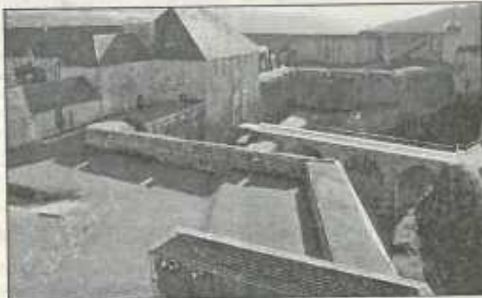
Les remparts de la Citadelle.