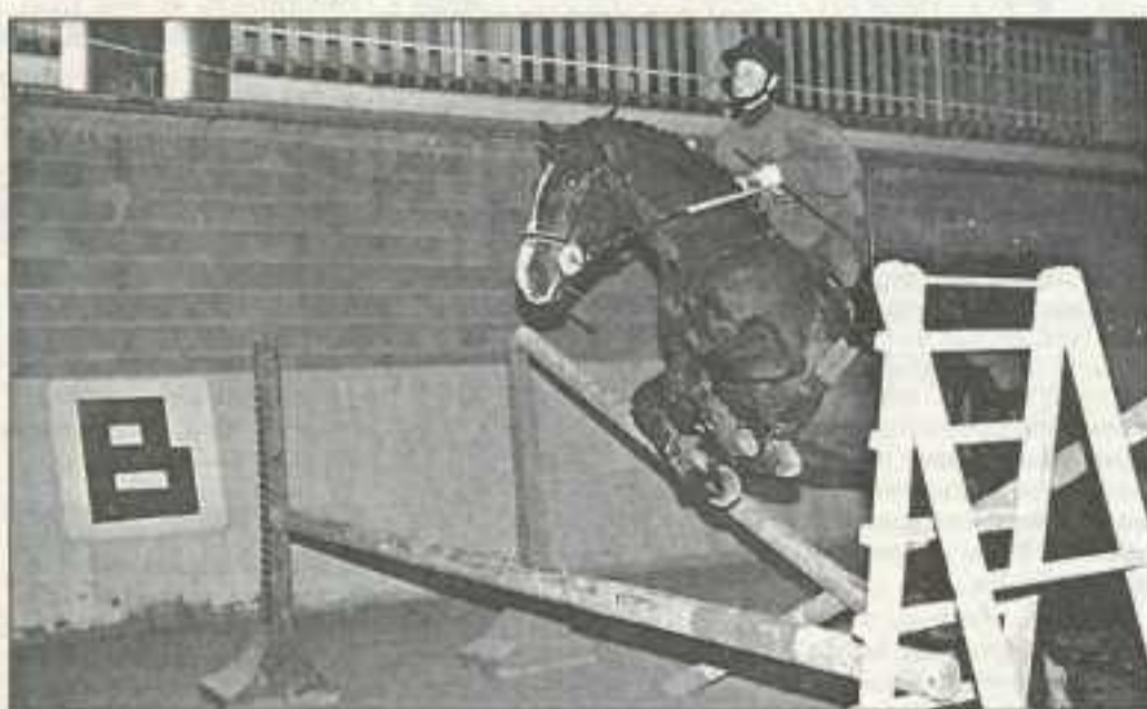
Le centre Pierre Croppet propose une heure d'initiation aux titulaires de la carte Avantages Jeunes.

d'Hirmont, Mathay. Tél : 03.81.35.27.32) : une reprise d'initiation à cheval ou poney.