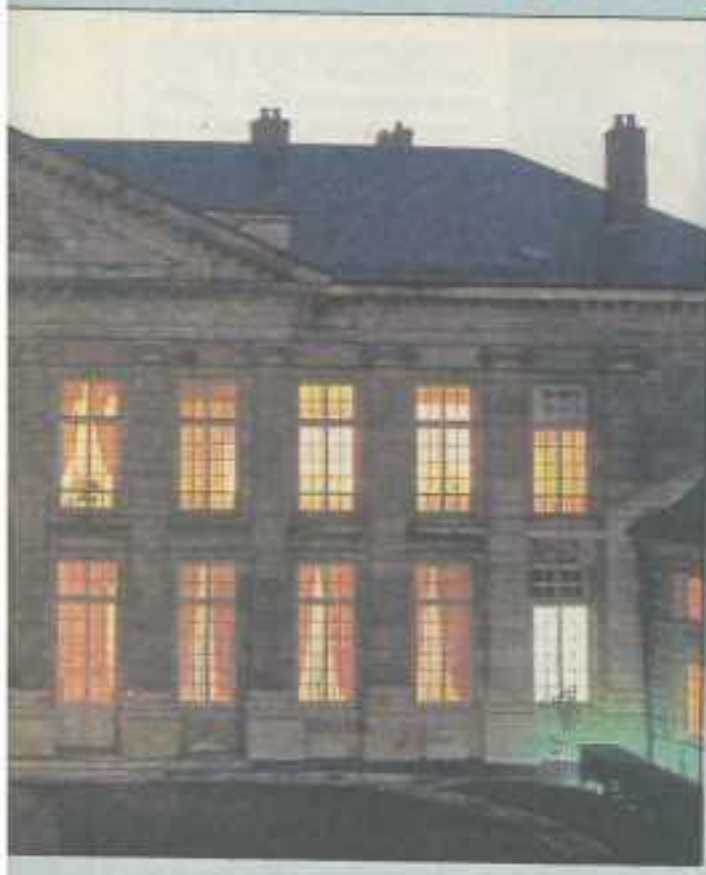
La préfecture de Franche-Comté à Besançon.

On est en train de préparer un projet de programmation des européens, dont on fixe pour les règles d'engagement. Tout sont des éléments qui ne vont durer tout le temps. Le paye le même. Pour ce qui me les services de l'Etat, il y enient ce qu'on appelle un proriorial qui doit être fait dans e département. C'est une noui, précisément en rapport avec occupation que vous expré. Le document fixe pour 3 ans les tifs des administrations de Des objectifs en termes soc, fonctionnels et en termes de n. D'ailleurs le Doubs a testé dée avec les départements de s-et-Loire et du Cantal. Dans t du ministère de l'Intérieur e de la délégation à la réfor l'Etat, ce qui est recherché, troduire de la permanence, de tuité dans les politiques. De ne façon que le ministère de eur a décidé que, contraire- la tradition, les préfets désre- rencontreront avant de se