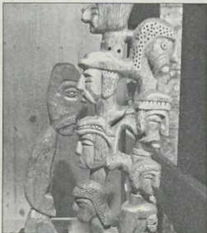
Le musée de l'art brut de Lausanne présente des œuvres de créateurs marginaux.

Belfort Information Jeunesse, 3 rue Jules Vallès, 90000 Belfort (03.84.90.11.11).