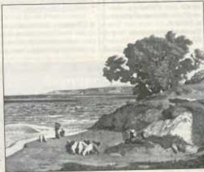
«Le Printemps» d'Alexandre Louis Patry.

Des centaines d'œuvres inédites d'artistes divers, originaux et talentueux seront montrées au public autour de quelques chefs d'œuvres comme «Madame de