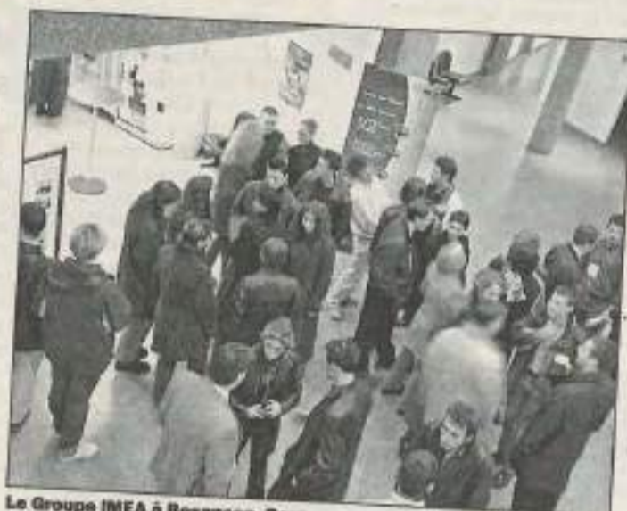
Le Groupe IMEA à Besançon. Pour en savoir plus sur les formations, une journée portes ouvertes est organisée en mai. Le 10 à Montbéliard, le 17 à Besançon.

fonctions qu'elles proposent. De même, il faut que les niveaux de formation collent à la culture de l'entreprise. En Franche-Comté, il y a beaucoup de patrons de PME auto-didactes ou de niveau bac + 2 qui se méfient un peu des jeunes plus formés. Il faut donc que ces derniers aient non seulement les compétences suffisantes pour aider l'entreprise mais aussi un comportement et un état d'esprit adaptés ». A ces idées qui orientent les formations du Groupe, s'ajoute une troisième nécessité moins acquise qu'il n'y paraît : « Avec la mondialisation, l'anglais est devenu obligatoire. Même pour une PME en Franche-Comté. Or il y a encore un retard sur ce plan ». Pour renforcer le lien avec le monde du travail, un comité de développement réunit tous les deux ou trois mois une vingtaine d'entreprises du Doubs dans le but de cerner les besoins en compétences nouvelles et d'adapter les programmes, qui évoluent de 10 à 20 % chaque année. Il n'étonnera pas que les stages sont au cœur des formations du groupe. Cette année, 260 étudiants sont inscrits, 260 stages sont prévus. Dans ce domaine, ils peuvent