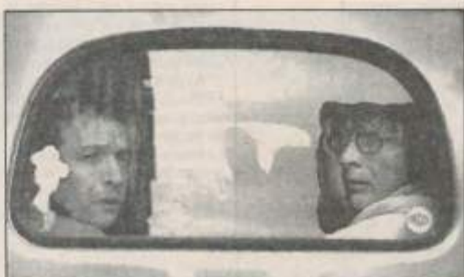
Les Fabulous Trobadors seront de la partie le 18.