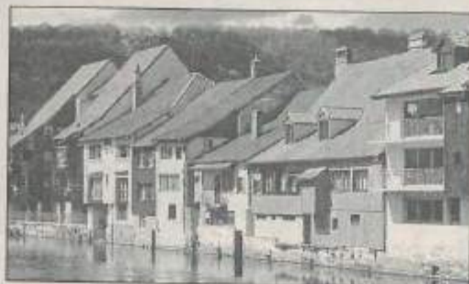
Rendez-vous à Ornans à partir du 11 mai.

OFFRIR au plus grand nombre l'occasion de découvrir le contenu et l'environnement du web, ainsi que ses enjeux de citoyenneté et d'intégration sociale, montrer une réalité parfois travaillée et transformée: telle sont les ambitions de >Bulles_Net< organisé à Ornans du 11 au 24 mai par l'office municipal des affaires culturelles soutenu entre autres par la communauté de communes du Pays d'Ornans, le Fonds régional d'art contemporain, le CRJ. Depuis 1995, l'OMAC programme du théâtre, des expositions d'art, des concerts et propose des ateliers de découverte (danse, théâtre, arts plastiques...) afin de promouvoir la culture dans la vallée de la Loue. Le Centre d'animation et de loisirs accueillera la manifestation composée d'une exposition d'art contemporain ( livres vidéos et photos prêtées par le FRAC) et d'un salon de démonstration.