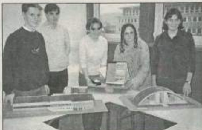
5 des 6 apprentis qui suivent cette année la MST.