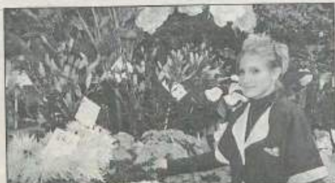
À La Roseraie (Besançon).