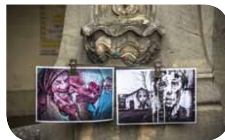
Ils veulent inciter à utiliser l'hôpital St-Jacques « en redonnant sens à la définition première de l'hospitalité ».