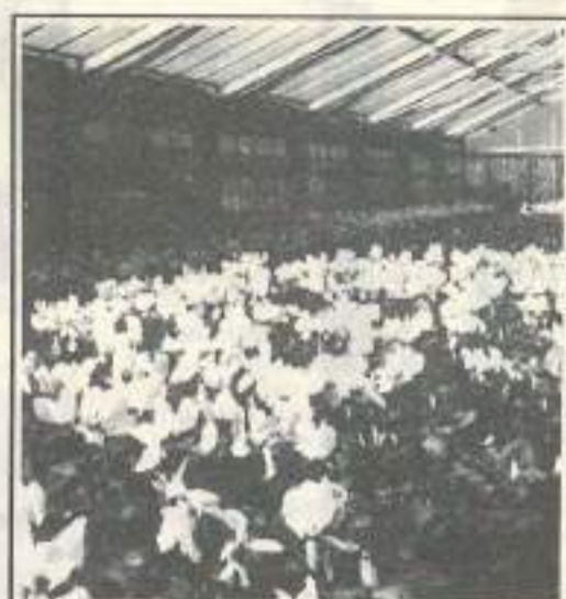
Ville de Besançon, service espaces verts

Salaire moyen brut mensuel en début de carrière : 5.300 F.