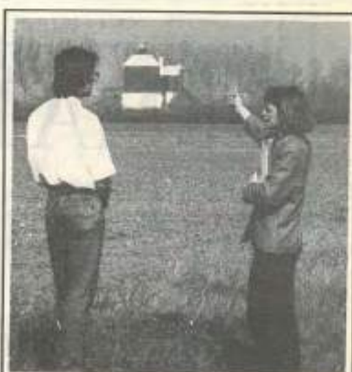
ICE - Eco-conseil