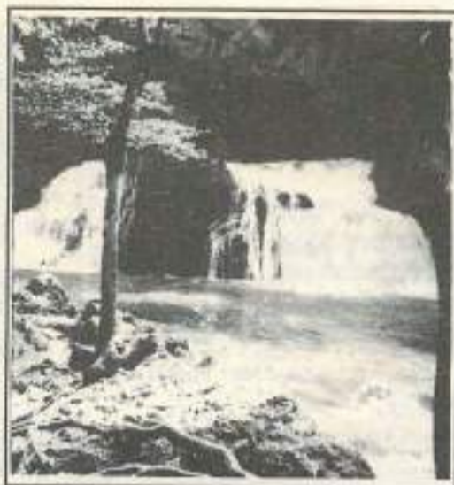
ADED - G. Citeau