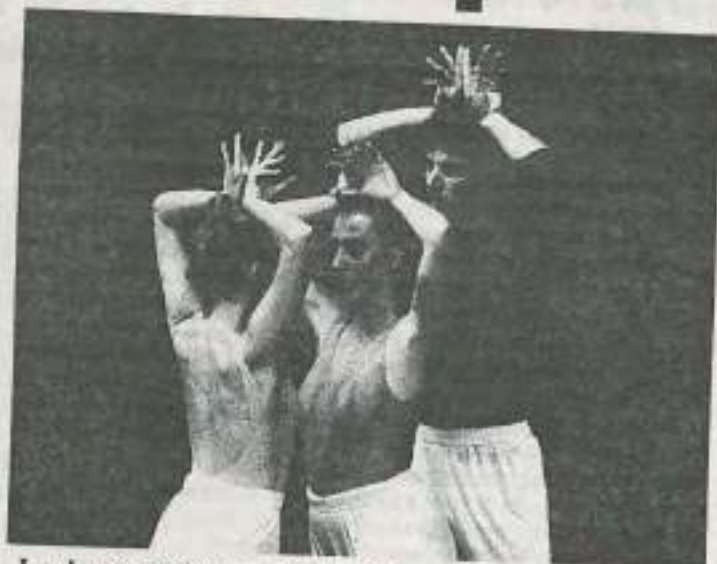
La danse contemporaine et le jazz gagnent du terrain

sable. De 6 à 7 ans, ils ne peuvent pratiquer qu'une activité de formation. Mais l'enseignement dispensé doit avant tout ne pas comporter de travail contraignant pour le corps, d'extensions excessives ou d'articulations forcées. Ce n'est que vers 8 ans que sont enseignées les techniques propres à la discipline choisie. Inutile donc, lorsqu'on suit un cours par semaine, de s'accrocher à l'image du petit rat d'opéra et d'exiger de l'enfant des techniques trop difficiles telles que les pointes. Le tout est de composer en fonction de ses propres moyens physiques. Les établissements contrôlés par l'État sont des structures idéales pour faire ses premiers pas. Il en existe dans toutes les grandes villes ; ce sont les conservatoires nationaux de région, les écoles nationales de musique et les écoles municipales agréées.