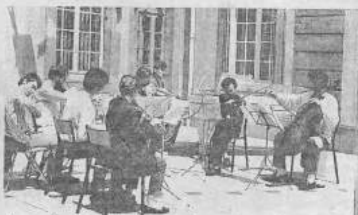
Une autre éducation à la musique : apprendre chez soi avec le soutien d'un professeur.

LES AVANTAGES retirés de l'apprentissage de la musique ne sont plus à démontrer : éducation de l'oreille, éveil du rythme et de la culture auditive, capacité de mémorisation et de concentration accrue. Les résultats d'études récentes ont prouvé que les enfants qui apprennent un instrument obtiennent de meilleurs résultats scolaires. Paradoxalement, malgré un effort accru au niveau de la formation des instituteurs, l'enseignement musical devient marginal dans l'éducation nationale dès l'entrée en 6ème. Ce qui explique notamment l'extension du tissu des écoles de musique tant publiques que privées dont huit élèves sur dix sont âgés de moins de 18 ans. Cette extension est d'autant plus facilitée qu'aucun diplôme n'est obligatoire pour enseigner la musique. Là encore, les conservatoires, les écoles nationales et les écoles agréées offrent le maximum de garanties quant au sérieux de la formation et la qualité de la pédagogie. Vous