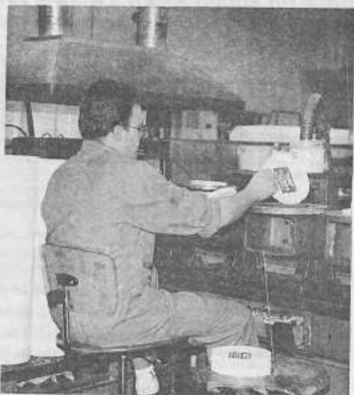
L'avenir est à la qualification : la plasturgie connaît une pénurie de techniciens, cadres et ingénieurs.

Source : Fiche Actuel-CIDJ N° 2.85432 « plasturgie » à consulter dans l'ensemble du réseau information jeunesse de Franche-Comté.