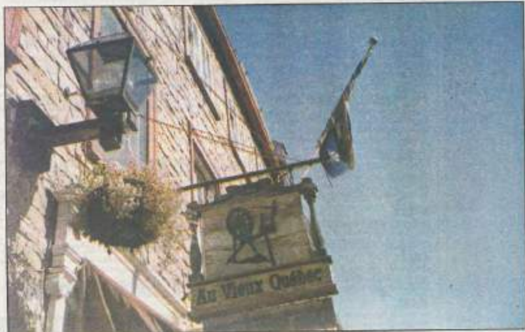
Un territoire immense et peu peuplé à la recherche d'immigrants.

Depuis 25 ans, 70 000 jeunes ont voyagé « utile » avec l'Office franco-québécois pour la Jeunesse. Recettes pour partir à votre tour.