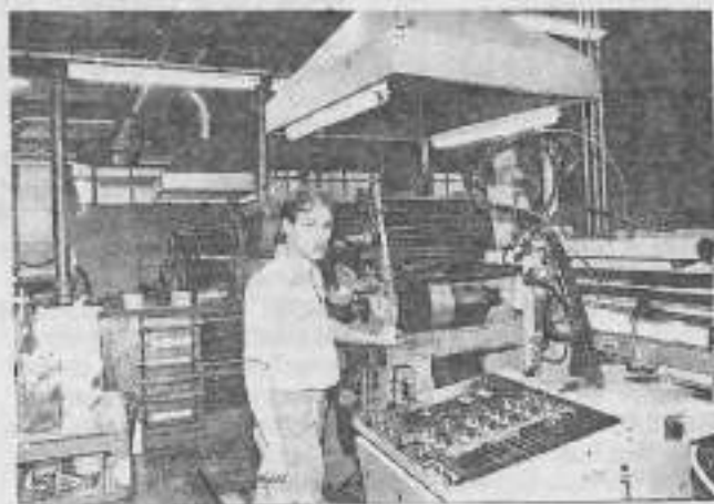
Réaliser un seau en plastique fait appel à une technique sophistiquée

Je suis réglleur dans l'atelier imprimerie. Concrètement, je suis chargé de veiller à ce que le graphisme proposé par le client soit conforme sur chaque seau en plastique sortant de ma machine. Au delà d'une fonction purement technique (réglage