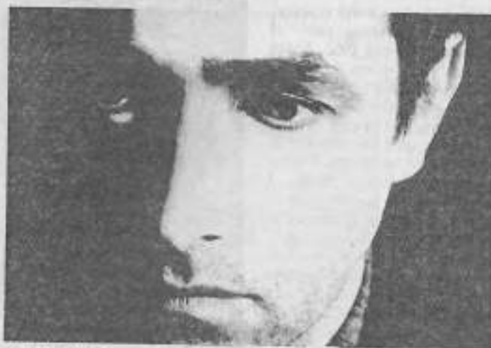
Au Thè'V le mercredi 16 mars à 20 h 30

Et, agréable surprise, Jean-Louis Murat, qui est loin d'être un imbécile aurait donc changé d'avis. Tout seul ou non peu importe. Depuis quelques mois il parcourrait donc les routes de France et de Navarre, se confrontant ainsi vraiment à des fans séduits par l'effort. Avec dans ses bagages, tout fraîchement distillé sur les ondes, un troisième album au succès sonnait comme une consécration: « Vénus ». Un peu la continuité du précédent, la pluie en moins. Mais avec toujours cette mélancolie forcée, presque désespérée, cette fragilité surprenante, que l'on