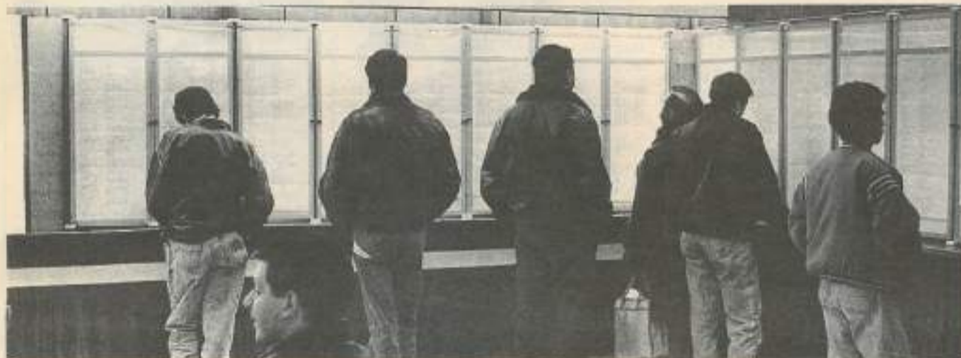
Le service logement des jeunes vous propose gratuitement un choix permanent de location chez les particuliers.

Le service logement est à votre disposition pour vous trouver gratuitement, et dans les plus brefs délais, un(e) jeune locataire. (Tél. 81.83.20.40).