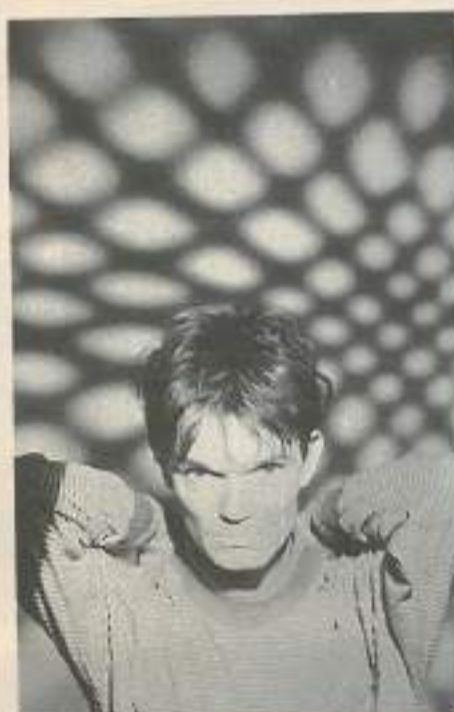
House of love, le groupe à la mode version Liverpool...soft très soft: sur scène le 29 juin