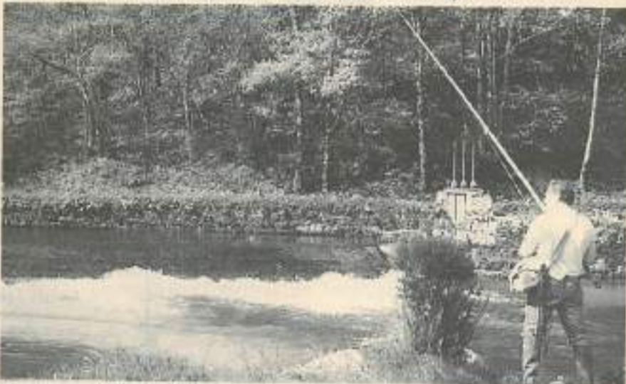
Les plateaux du haut-Doubs comptent parmi les plus belles réserves mondiales pour la pêche à la mouche

Lieu de rencontres, mais aussi centre de valorisation et de vulgarisation du patrimoine aquatique, la Maison de la pêche présente une des plus belles collections de matériel de pêche et retrace, à travers une exposition, l'évolution des techniques et technologies en eau douce (36, rue Saint-Laurent - 25290 Ornans; tél. 81.57.14.49).