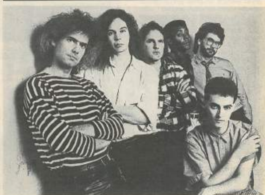
Jazz en Franche-Comté, c'est aussi le groupe de Pat Metheny le lundi 8 juillet au Kursaal de Besançon (location au CII), (photo J. Frohman)