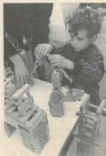
Futur architecte, peut être...

Les visites de villes organisées à pied, en bus, en petit train par les offices de tourisme des grandes agglomérations, les sites archéologiques comme la cité lacustre de Chalan, le théâtre gallo-romain de Mandeure ou le site de Villards-d'Héria.