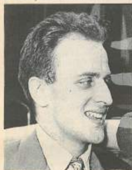
Cabaret, chansons de Boris Vian et Bobby Lapointe tous les mardis, vendredis et samedis du 14 juin au 13 juillet inclus au château de Belfort.

Les 22 et 23 juin, saltimbanques mettant en scène divers contes et légendes, cracheurs de feu, illusionnistes défilent ainsi dans la cité puis les instruments de musique, les musiciens et les danseurs investiront enfin la moindre parcelle de terrain.