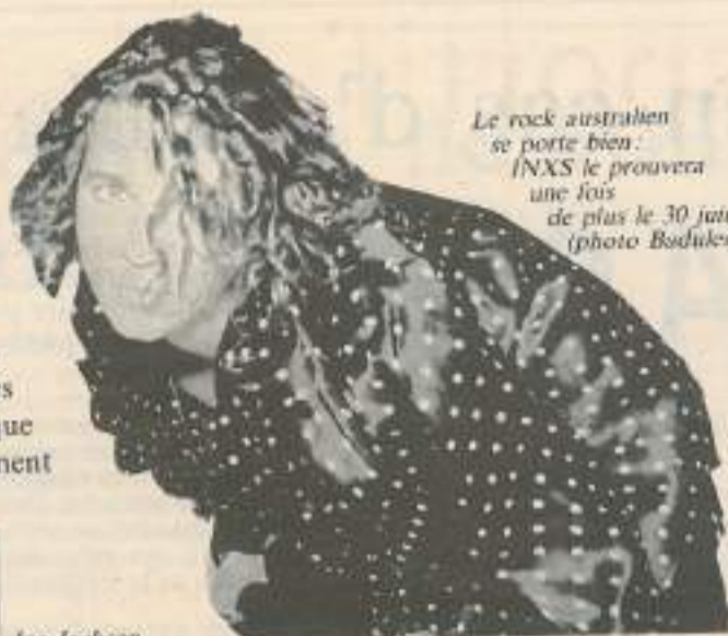
Le rock australien se porte bien: INXS le prouvera une fois de plus le 30 juin

Lancées en 1989 par le Conseil général du Territoire de Belfort, les Eurockéennes signent leur troisième édition du 28 au 30 juin sur les berges du lac de Malsaucy. Deux innovations pour cette version 91: un mariage transfrontalier avec le festival suisse de Leysin, fort de six années d'expérience, afin d'asseoir une véritable politique culturelle européenne et un soutien, un engagement humanitaire dans la lutte contre le sida.