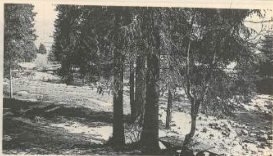
La source du Doubs à Mouthe