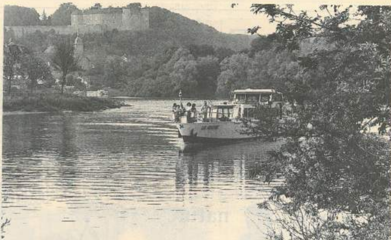
Découvrir le long de la Saône, les villages typiques en sillonnant les 130 km de parcours ouverts aux bateaux à moteur

— Promenade sur le Doubs, au départ de Besançon (pont de la République à Besançon ou « Les vedettes bisontines » au 81.68.13.25 ou encore « Les bateaux-mouches », au 81.68.05.34).