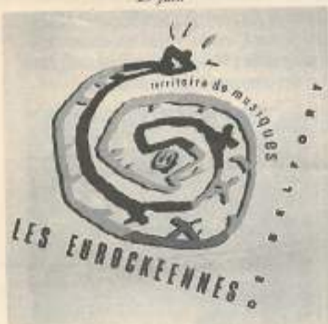
Pour tout savoir sur les Eurockéennes, un seul numéro: le 84.21.85.85.