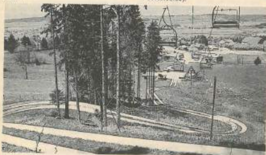
Luge d'été à Métabief

Outre un enrichissement personnel, les parcours et activités proposés ont été conçus dans le but de procurer une détente maximum pour un effort minimum.