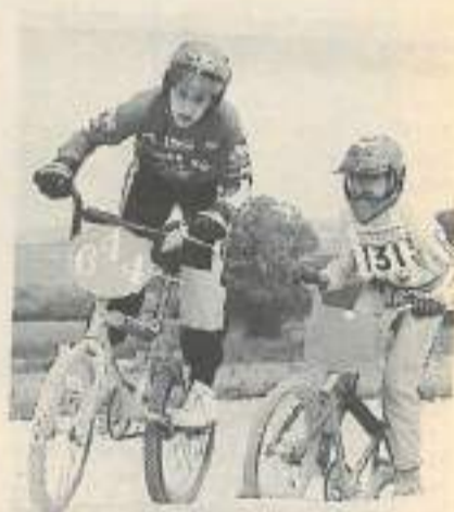
Une valeur sûre et prometteuse : le vélo tout terrain

- A signaler encore le « passeport vacances » des Francas (84.21.10.22) grâce auquel les jeunes de 12 à 17 ans peuvent découvrir près de 40 activités différentes.