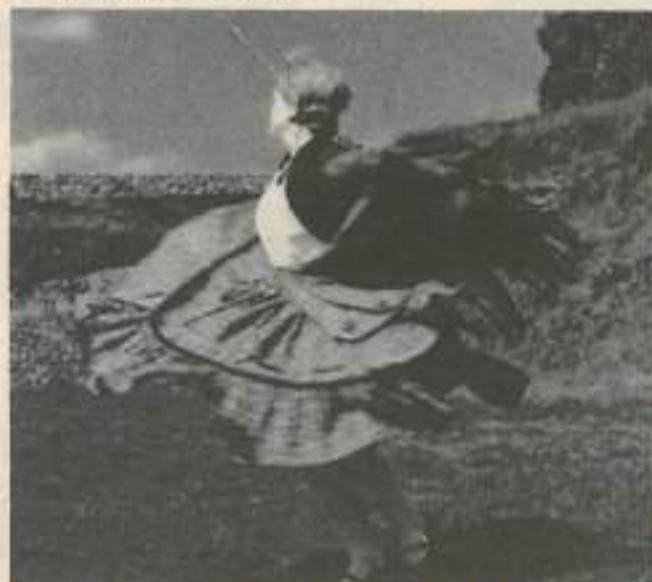
Le ballet Goranine, invité d'honneur de cette rencontre, représentera la Yougoslavie

Si la danse, le chant et la musique sont des modes d'expression universels reflétant l'air du temps, le « folklore » est le témoin d'un patrimoine régional ou local.