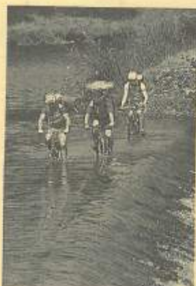
L'un des moments forts du grand rendez-vous VTT «Indiana Saône»: le passage de la Saône près de Scey-Saint-Albin.