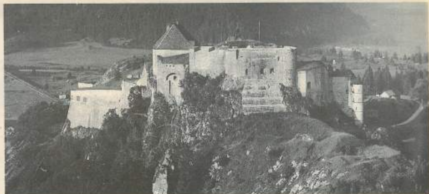
Le château de Joux, sentinelle de la trouée de la Cluse et Mijoux.