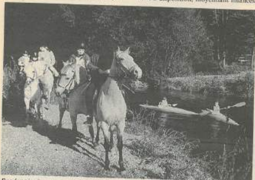
Randonnées équestres ou nautiques pour apprécier les mille visages d'une nature préservée