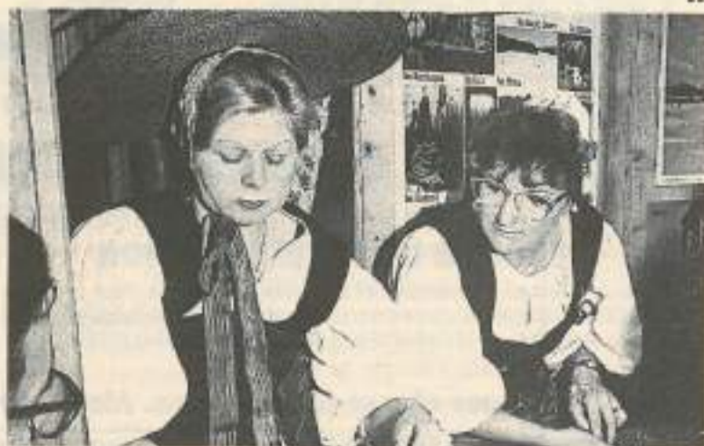
A découvrir cet été lors des fêtes de pays, les costumes traditionnels francs-comtois

- Les 7 et 8 septembre, 16e rallye de Franche-Comté des vieux-voitures (tél. 81.94.19.14).