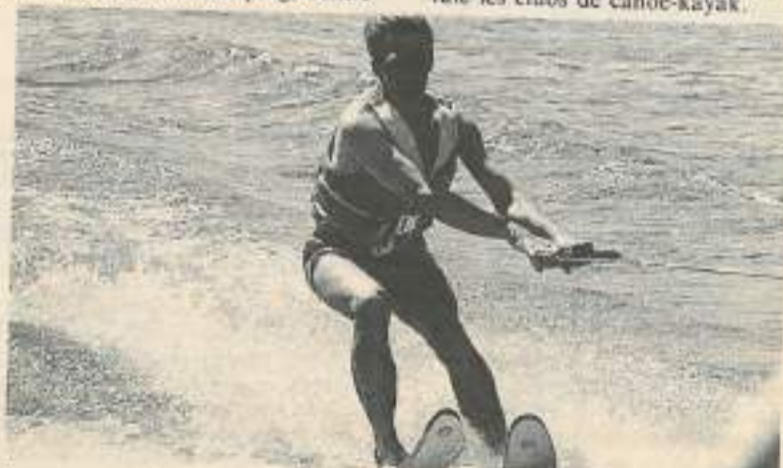
Tous les sports nautiques y compris le ski nautique notamment sur le lac de Chaillexon

- Et aussi et encore l'association base touristique de Montbozon (84.92.32.30), le pays d'ampierrois et fresnois (84.67.08.49) et de façon générale les clubs de canoë-kayak.