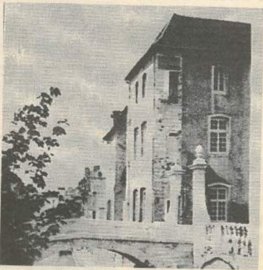
Depuis plusieurs années, l'ICEP, situé au centre ville à Dole, propose dans un cadre exceptionnel toute une gamme de formations en prise directe sur l'entreprise

2 statuts possibles: soit stagiaire de la formation professionnelle, soit salarié en contact de qualification. La formation est gratuite pour les salariés qui bénéficient de la couverture sociale des salariés.