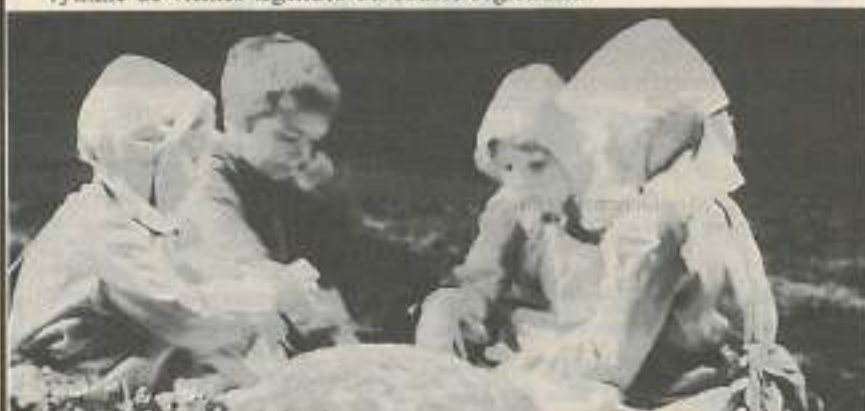
« Le médecin des pauvres » au Château de Présilly (70) du 5 au 7 juillet, du 12 au 14 juillet, du 19 au 21 juillet et du 26 au 28 juillet.

Merveille de la pyrotechnie, les monuments de la région s'illuminent au rythme de vieilles légendes ou contes régionaux.