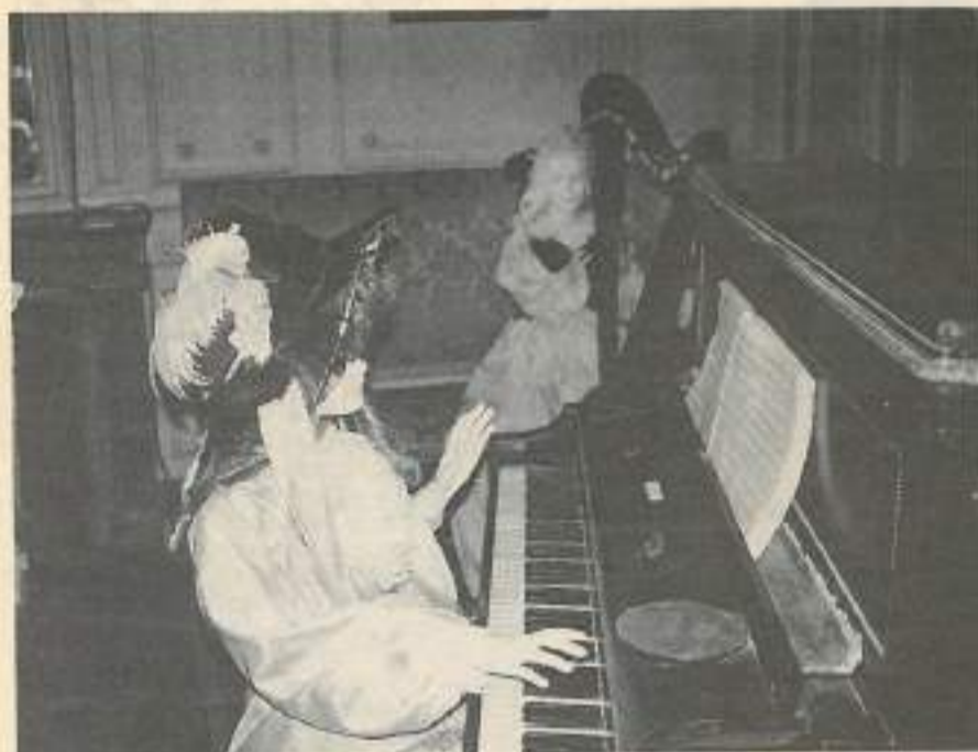
Le monde des automates du château de Fabulys (Jura) retrace la vie au XVIII e siècle (ouvert tous les jours de 10 à 17h, tél. 84.72.32.34).