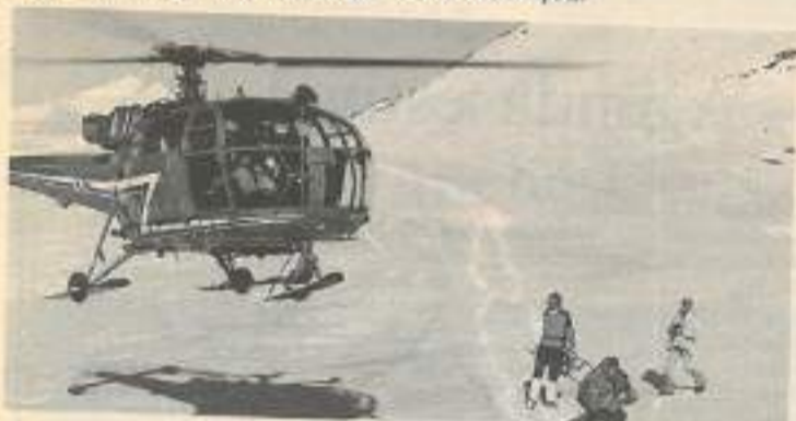
Avec l'assistance carte jeunes partez en toute tranquillité ! Où que vous soyez toute une équipe pour vous secourir et vous aider

Prix de vente : 70 F - Renseignements et achat : service billetterie - CIJ - 27 rue de la République - 25000 Besançon.