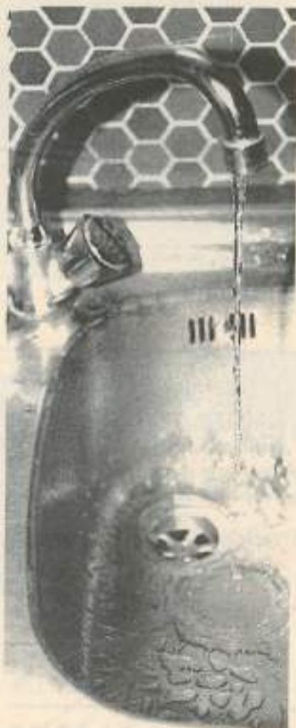
L'eau potable, un bien dont il faut éviter le gaspillage