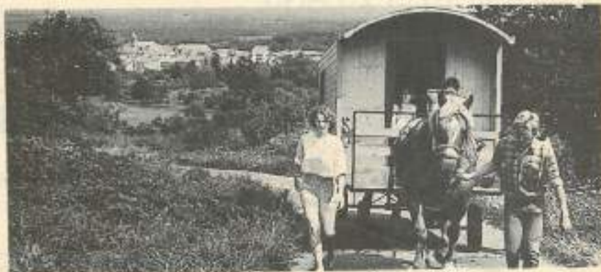
Le temps des gitans... version franc-comtoise.

Renseignements et inscriptions : CUI - 27 rue de la République - 25000 Besançon - tél. 81.83.20.40.