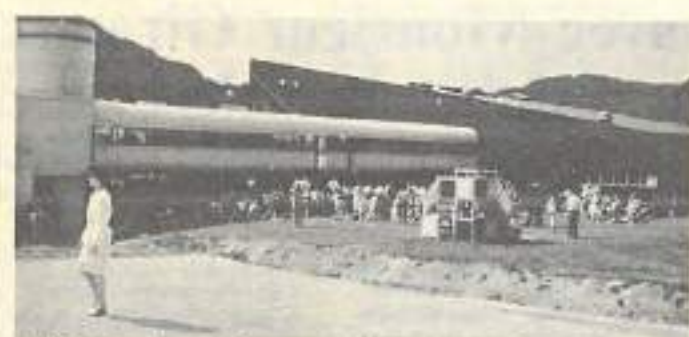
Au Musée du Jouet de Moirans-en-Montagne, exposition exceptionnelle de plus de 5.000 jouets du XIXe au XXe siècle

Il est disponible gratuitement dans l'ensemble des sites associés à cette opération : Taillanderie de Nans-sous-Sainte-Anne, Saline royale d'Arc-et-Senans, Musée Peugeot de Sochaux, Forges de Syam, Salines et Falencerie de Salins-les-Bains, Musée de la Boissellerie de Bois d'Amont, Musée du Jouet de Moirans-en-Montagne, Forge-musée d'Etueffont, Ecomusée de la distillation de Fougerolles, Maison de la mine de Ronchamp, Verrerie de Passavant-la-Rochère, Musée départemental Albert Demard de Champplitte et Musée de plein air des Maisons comtoises de Nancrey.