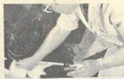
L'employeur appelle femme de ménage, l'employée de maison qui travaille quelques heures chez lui

L'employé de maison, homme ou femme, effectue des tâches domestiques au domicile de son employeur : ménage, nettoyage des sols et des vitres, repassage, préparation des repas, entretien courant de la maison.