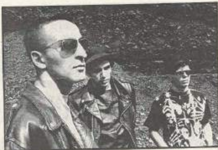
Avant de les découvrir sur scène aux Eurockéennes le 2 juillet 93, les Rattle-Snakes sortent leur premier C.D « Moonlight Shadows ». Disponible chez tous les disquaires en Franche-Comté ou auprès de « Serpent à sonnettes productions » - 9, rue de Zaporozje - 90000 Belfort - tél. 84.26.34.82