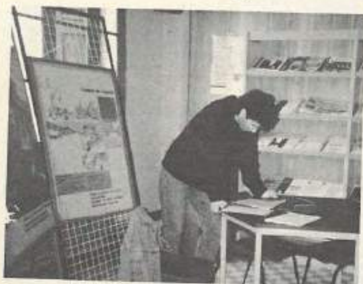
Le PIJ de Damparis présente de manière pratique tous les secteurs d'activités professionnelles, à partir de plusieurs supports qui se complètent (guide des métiers, carte CIDI, dossiers ACTUEL-CIDI et ACTUEL-FRANCHE-COMTE...)

Le PIJ est situé, rue des Aliés à Damparis. (tél. 84.81.19.71).