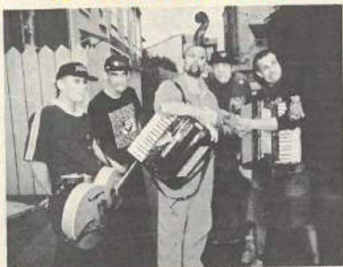
Les French Lovers pour retrouver une ambiance « bastringues » de bord de Marne

Pour leur 5e édition, les Eurockéennes ont décidé de faire du bruit. Mais sans gêner personne puisque c'est toujours sur la superbe base nautique du Malsaucy qu'ils vont se rassembler. Avec vue sur les Vosges et plongeon possible dans l'eau fraîche en cas de grosse chaleur.