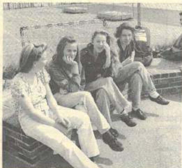
Avec 48 collèges publics et 18 privés, le département du Doubs dispose d'un réseau actif et performant qui permet d'accueillir environ 30.000 enfants

● L'enseignement supérieur (engagement du Conseil Général dans le