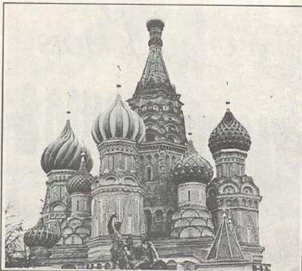
Une opportunité à saisir pour découvrir la Russie

Délégation internationale UNAREC - Etudes et Chantiers - 3, rue des Petits Gras - 63000 Clermont Ferrand - Tél. 73.31.10.74