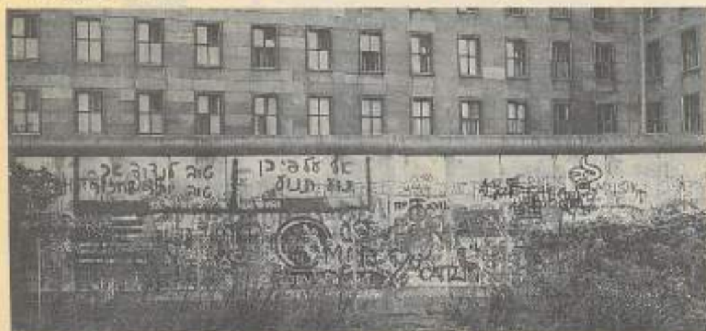
Le nouveau Nouveau-Monde