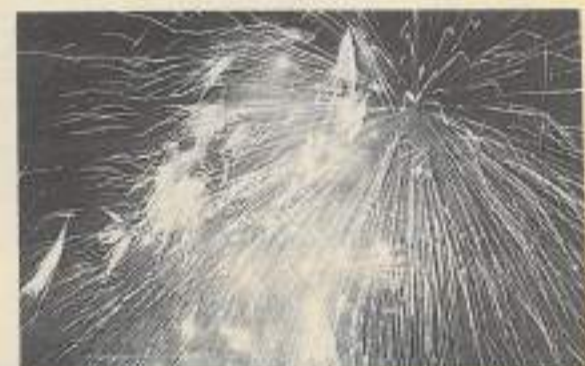
Depuis 1987, Extincelles crée l'événement et envoie l'imaginaire des Montbelardais et autres admirateurs de Prométhée.

Les billets achetés pour le mois de juin restent valables. Pour ceux qui ne les avaient pas encore, le prix des places est à 40 F et à 70 F en tribune réservée (tarifs réduits pour carte jeunes, chômeurs, groupes... 30 F).