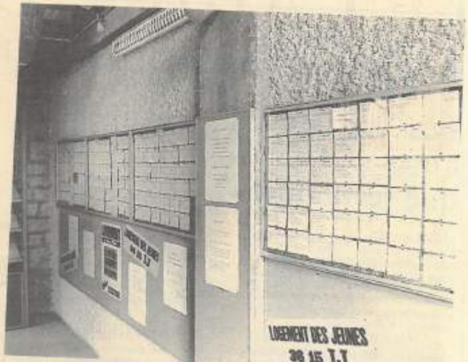
Les offres de location du service logement sont affichées et renouvelées chaque jour dans les locaux du Centre Information Jeunesse, 27, rue de la République à Besançon.

— Le loyer proposé doit être fixé dans des limites « raisonnables ».