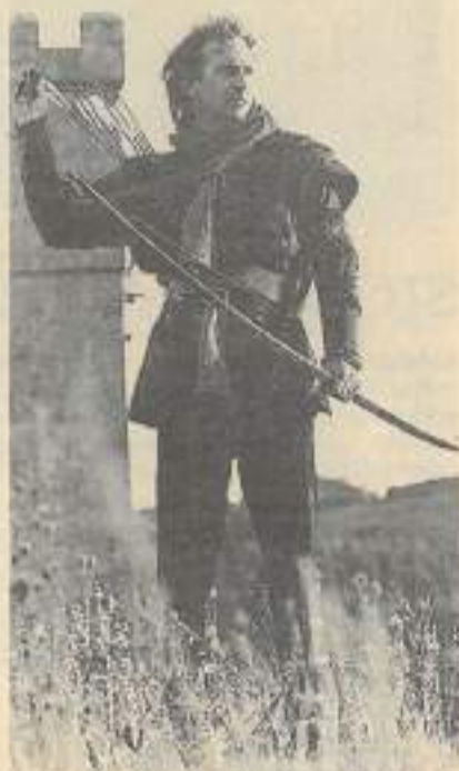
14e version pour un « Robin des Bois » de charme (s)!

Et, pour accéder aux autres salles obscures de la région, tarif réduit sur présentation de votre carte jeunes.