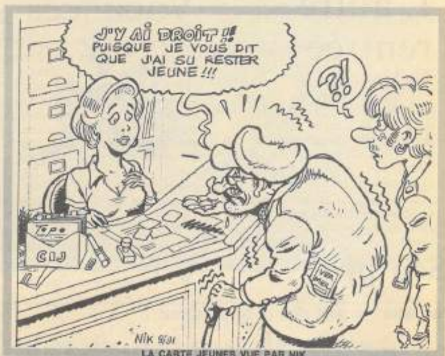
LA CARTE JEUNES VUE PAR NIK