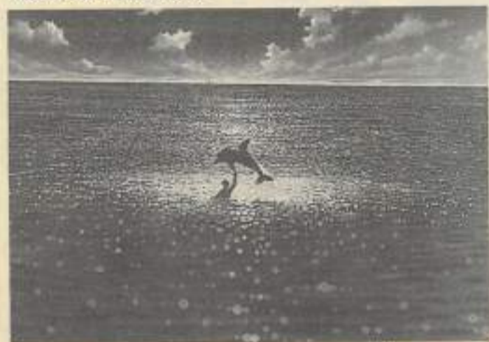
Une autre façon de participer au « grand bleu »

Renseignements : Association Corse du monde sous-marin, tél. 95.25.08.18.