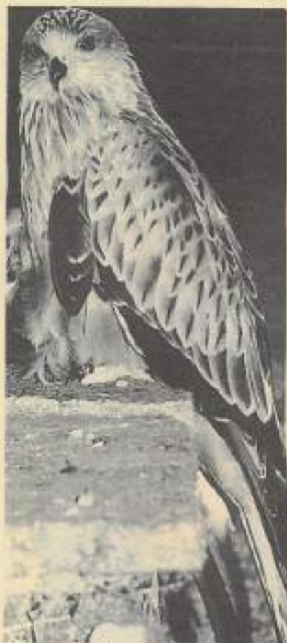
Le milan noir, charognard de son espèce se contente de tout ce qui traîne à la portée de son bec.

Aussi, afin d'agir pour leur protection, le projet «Pèlerin» fut mis au point par ce groupe d'amis. Après un travail de longue haleine et de multiples craintes, naquit de leur énergie