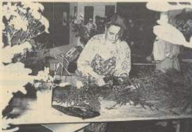
Au CFA Hilaire-de-Chardonnet, formation au métier de fleuriste en fleurs naturelles.

Ariculture, agro-alimentaire, bâtiment, travail matériau, électrotechnique, électronique, automatisme, mécanique, contrôle industriel, production, manutention, informatique, comptabilité, commerce, coiffure, esthétique, hôtellerie, restauration, pharmacie, prothésiste dentaire, audiovisuel, imprimerie.