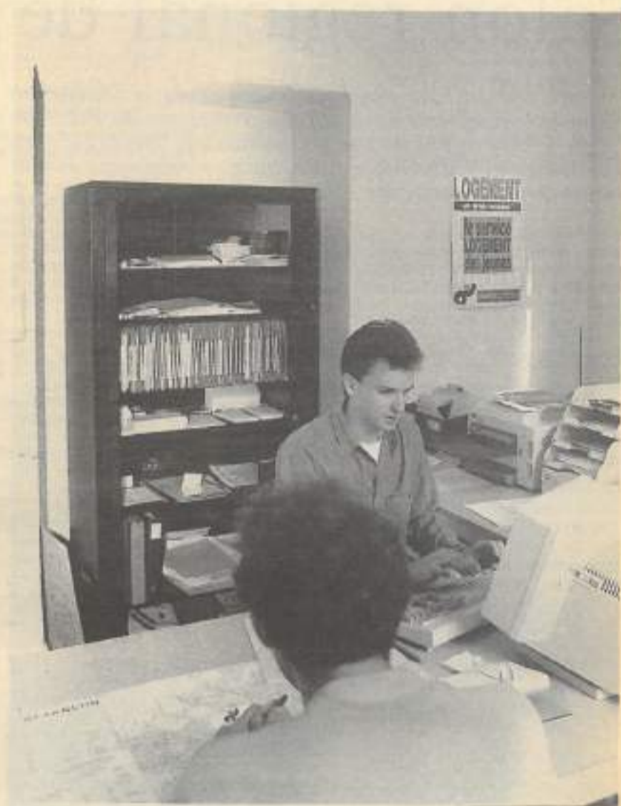
Le service logement est gratuit, ouvert à tous et sans rendez-vous.

Pour tous renseignements : Service logement des jeunes, Centre Information Jeunesse, 27, rue de la République, 25000 Besançon (tél. 81.83.20.40).