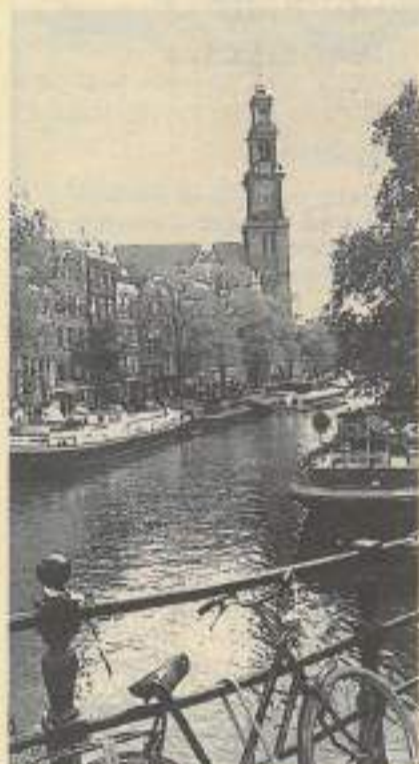
En Hollande, la Carte Jeunes vous ouvre les portes du monde culturel.

Dix-huit pays ont aujourd'hui ratifié la convention de Lisbonne, permettant la réciprocité des quelques 200.000 avantages du territoire européen, pour 2.000.000 titulaires.