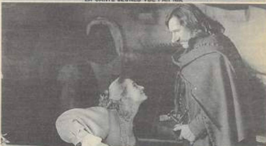
Depardieu et son bel appendice... dans « Cyrano de Bergerac ».