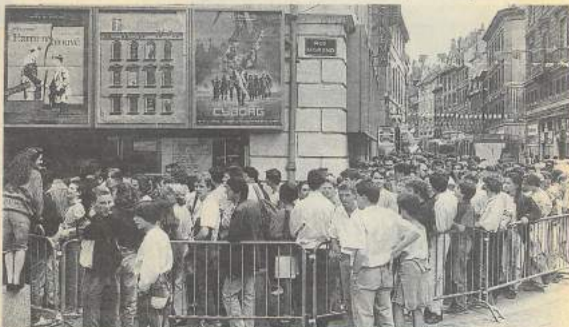
Pendant 364 jours les titulaires de la ciné Carte jeunes ne font jamais la queue sauf... le jour de la fête du cinéma.