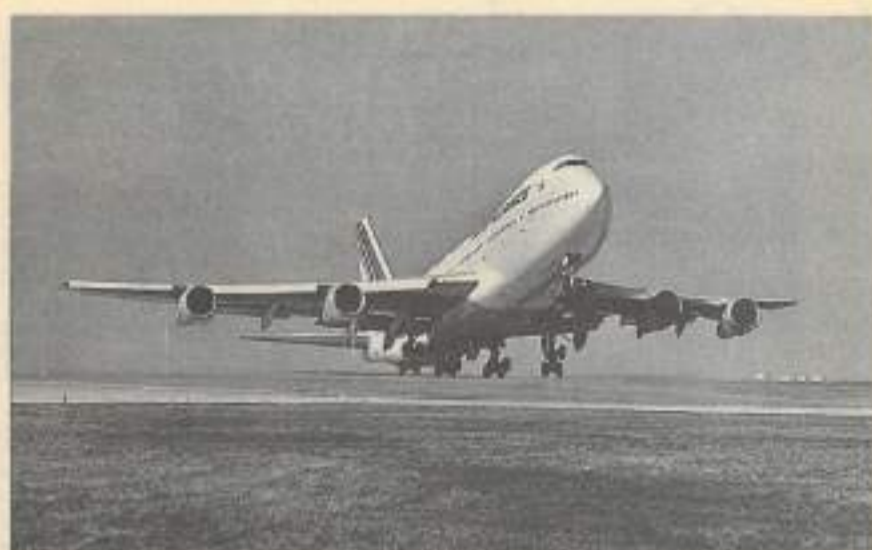
Une autre façon de décoller : le service voyage Carte jeunes. 16 (1) 46.62.07.08.