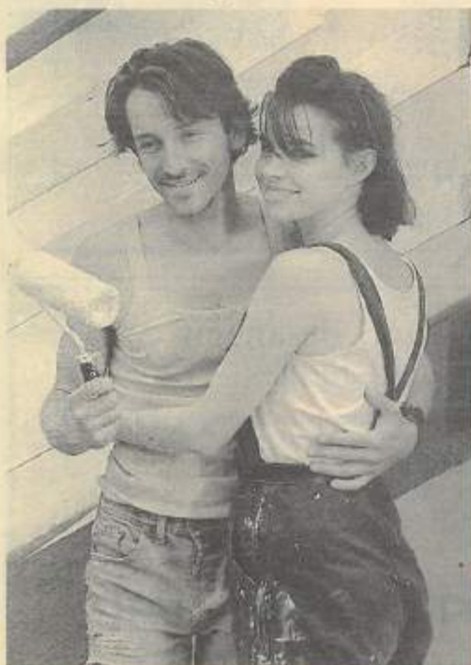
Djian porté à l'écran! « 37°2 » de Beines.