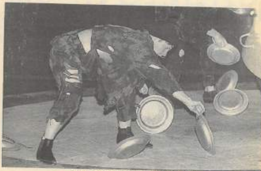
« Les pieds dans le plat », spectacle Bonbeck par la Cie des chercheurs d'air (Photo G. Vieille).

Remerciements au CDES du Doubs pour la documentation.