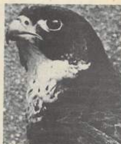
Le faucon pèlerin, mélange de puissance contenue et de finesse est taillé pour la vitesse et la chasse de haut-vol.

le public dans cette lutte, le FRIR, en accord et en collaboration avec l'académie de Besançon, intervient dans le monde scolaire en pratiquant de nombreuses animations. Des soirées projection-débat, des animations sorties sur le terrain, une présence très forte sur les différents lieux d'exposition et de rencontres en Franche-Comté sont autant d'autres implications qui permettent d'amplifier et de diversifier le public.