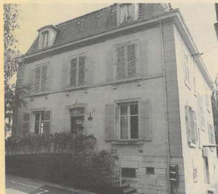
Le BIJ est ouvert du mardi au samedi de 9h à 12h et de 14h à 18h. Le mercredi, fermeture à 19h.

cessible en autodocumentation et une informatrice-documentaliste sera à la disposition du public pour toute information supplémentaire. Pour compléter ces deux supports d'information le BIJ de Montbéliard met aussi l'accent sur la télématique.