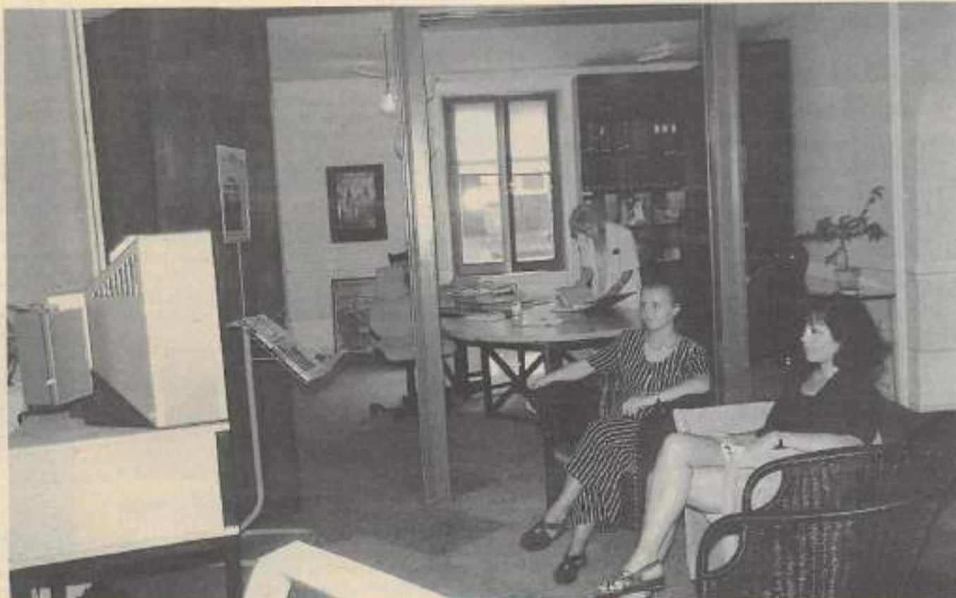
Le coin vidéo pour une présentation conviviale des différents métiers.

L'information traditionnellement traitée par secteur d'activité sera ac-