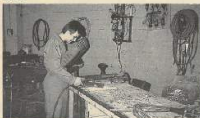
Autre filière de formation : la mécanique dont le CAP de carrossier-réparateur.