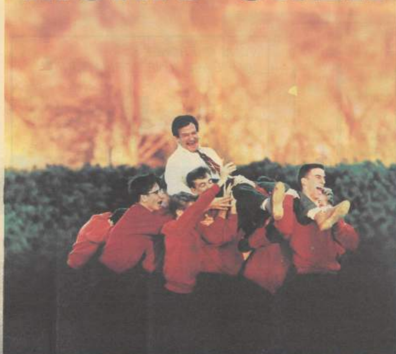
Le cercle des poètes disparus - (c 1989 Touchstone Pictures).