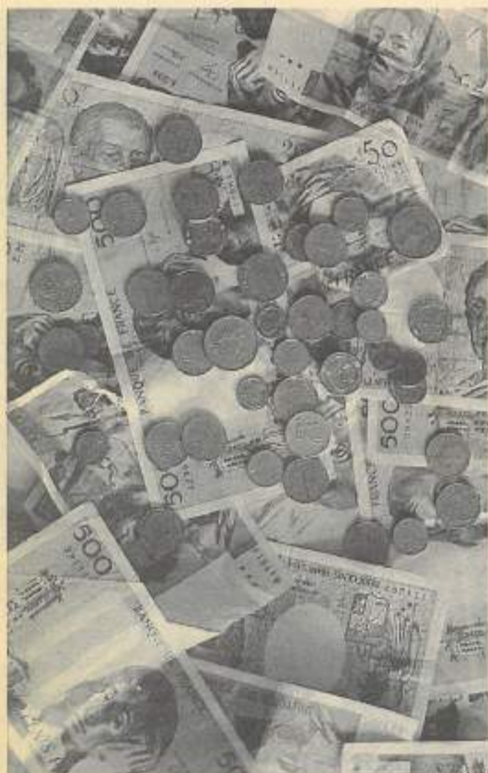
Toute omission ou fausse déclaration peut provoquer des conséquences financières très graves en cas d'accident corporel.