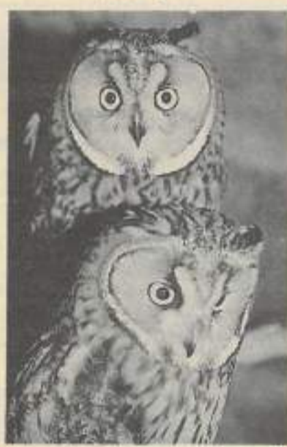
Hiboux, chouettes, des oiseaux à mauvaise réputation si l'on en croit les contes et légendes de nos provinces.