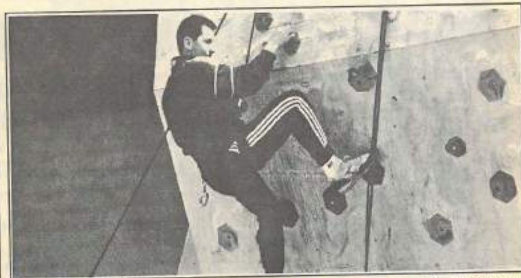
Un bloc modulable de 5 m de haut, composé de quatre panneaux permettra aux visiteurs du Salon de la Jeunesse de s'essayer à l'escalade. Une initiation à ce sport effectuée sous l'égide de l'Armée de terre, qui fournit le rocher et le matériel pour monter. En démonstration pendant les trois journées, utilisation gratuite.