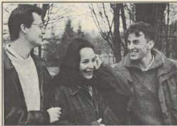
Début de la course, 17 mars.

Elles demanderont également des recherches bibliographiques et autres démarches spécifiques. Avec une précision, « il ne s'agit en aucun cas d'un rallye, mais plutôt d'une histoire à déchiffrer » sans aucune limitation de temps. Il est donc vivement demandé à la personne qui déterminera le coffre de faire savoir que le jeu est terminé.