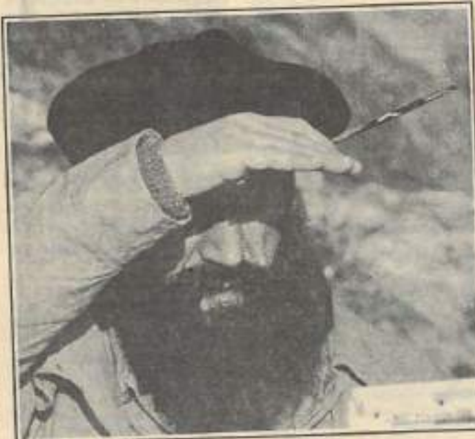
HUILE SUR TOILE, de François Royet

La programmation de courts-métrages du Salon de la Jeunesse témoigne tout d'abord de la vitalité de la création régionale avec HUILE SUR TOILE, CLAQUE DE FIN, LA NUIT D'UN SACRE, tout en s'ouvrant sur d'autres films sur le thème de la jeunesse - 75 CENTILITRES DE PRIERE, TOUS A LA MANIF - . A ceux-ci s'ajoutent deux films de la série « 3000 scénarios contre un virus » répondant à un besoin d'information à partir d'une histoire grave ou ludique.