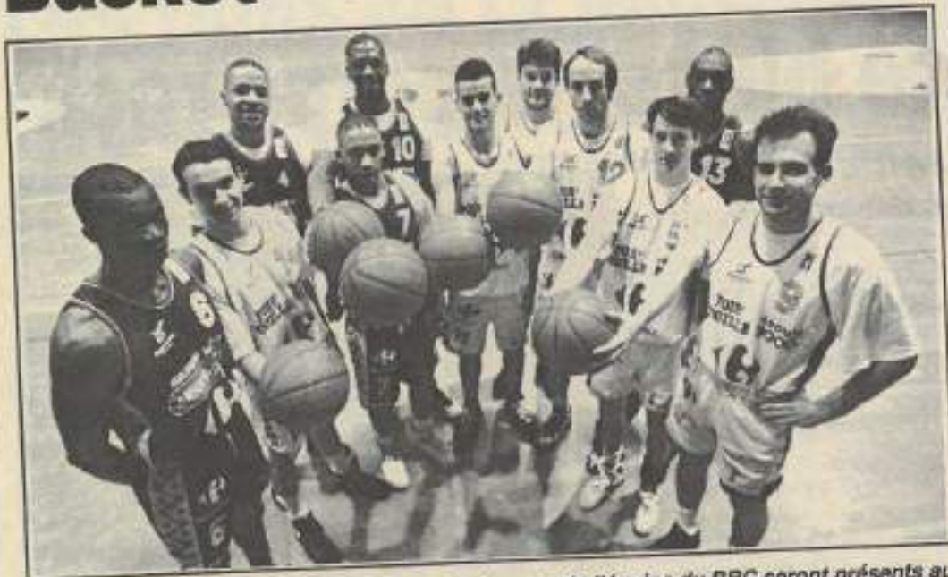
Le vendredi 17 mars, de 14h à 16h, tous les joueurs de l'équipe du BBC seront présents au salon de la Jeunesse. Pour discuter du basket de haut niveau et signer des autographes.