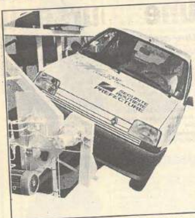
La voiture tonneau pour convaincre de l'intérêt de boucler sa ceinture.

En permanence, des inspecteurs départementaux de la Sécurité routière seront présents sur place pour répondre à toutes les questions. Un coin aménagé sur le stand assurera aussi la promotion de l'apprentissage anticipé de la conduite (à partir de 16 ans). Une formule qui entre dans les mœurs et dont les premiers bilans, au début de l'expérience, ont démontré que les jeunes conducteurs étaient ainsi 7 fois moins impliqués que les autres dans des accidents.