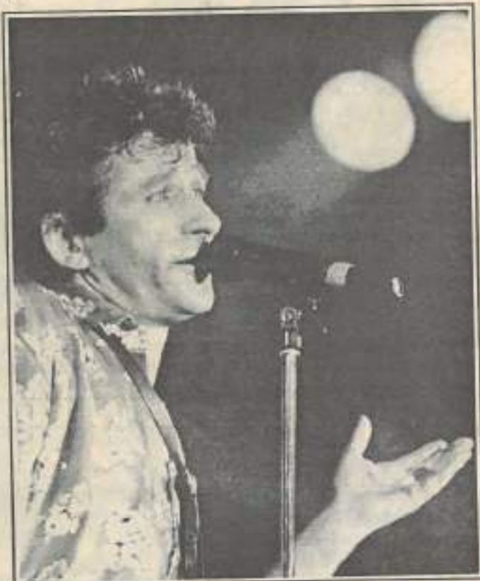
Une douzaine d'albums, dont les premiers, vingt ans après, se vendent toujours.

Une menace qui se précise dans son avant dernier disque : « L'horreur est humaine, clinique et banale / enfant de la haine, enfant de la peur / l'horreur est humaine, médico-légale / enfant de la haine, que ta joie demeure ». De toute façon,