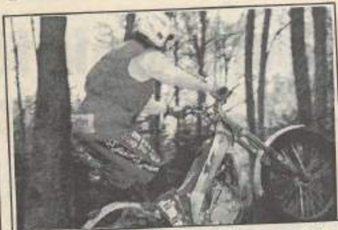
Des démonstrations de trial auront lieu dans l'enceinte du Salon de la Jeunesse.