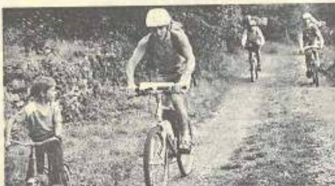
Les crédits ainsi débloqués auront pour but de soutenir des actions départementales visant à développer notamment la pratique du sport de masse.

En ce qui concerne les comités départementaux sportifs, le dossier porte sur le nom-