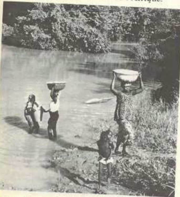
« D'une boucle à l'autre », celles du Doubs et de la Volta Noire, est une réalisation originale menée par une équipe de bénévoles soutenue par l'atelier audiovisuel de Besançon.

Pour fêter les 10 ans d'échanges et de coopération entre la ville de Besançon et la région de Douroula au Burkina-Faso, le service culturel de Besançon organise une série de manifestations sur le thème de l'Afrique.