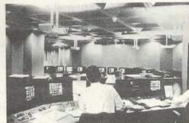
L'informatique a révolutionné les pratiques boursières; la séance classique à la criée est aujourd'hui en voie de disparition.

Nombreux sont ceux qui ont rêvé se retrouver dans l'atmosphère fiévreuse des séances boursières. Avant de vous lancer seul dans le jeu de la bourse, la Caisse d'épargne de Franche-Comté vous propose de vous initier aux marchés financiers.