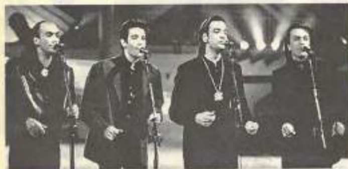
L'un des grands vainqueurs des « Victoires de la Musique 93 »

Quatre voix « a capela » s'élèvent sur la scène, quatre garçons de noir vêtus... les Pow Wow par la magie de leurs chants puisés dans une tradition cosmopolite nous enchantent par leur seule envie de chanter. Des accents parfois primitifs au chant grégorien en passant par les négro-spirituals, la palette des Pow Wow séduit tous les publics. A voir le 3 avril au théâtre municipal de Besançon