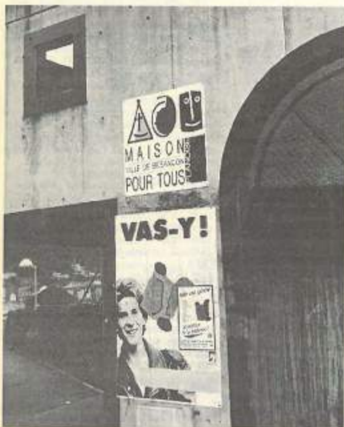
Le Point information jeunesse (PIJ) de Planoise travaille en collaboration avec le Centre information jeunesse de Franche-Comté