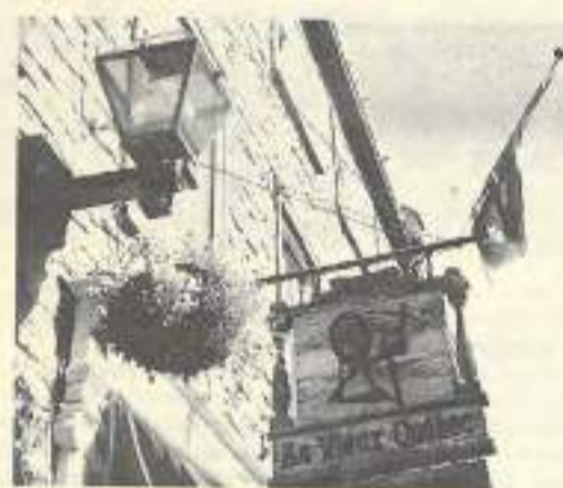
France - Québec, une amitié de longue date concrétisée par les programmes d'échanges de l'Office franco-québécois pour la jeunesse

Le principe du programme est basé sur la réciprocité d'accueil qui doit impérativement se réaliser sur l'année 93. Chaque partenaire accueille son homologue pour une durée de 4 semaines minimum. Il sera chargé d'organiser le séjour de son hôte en respectant ses attentes et ses objectifs, en l'introduisant auprès du milieu professionnel et en lui faisant découvrir notamment les interventions mises en place dans la région. Il veillera également à