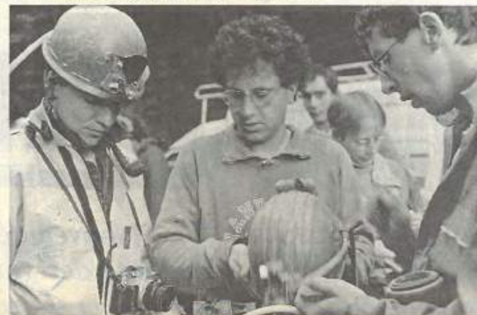
La formation DEFA se préoccupe de la communication tout en y associant la pratique d'activités sportives

Pour tout renseignement contactez: CREPS de Franche-Comté - 27, rue Sancey - BP 1983 - 25020 Besançon cedex - Tél. 81.41.26.26