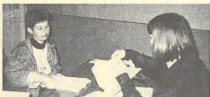
Les Missions Locales et les PAIO sont à l'écoute des jeunes en difficulté d'insertion sociale et professionnelle

PAIO accueillent les jeunes de 16 à 25 ans rencontrant des difficultés d'insertion. Elles cherchent avec eux à résoudre les problèmes de formation et d'emploi. A ce titre, elles les informent sur les possibilités d'entrer en formation et de trouver un emploi. Elles les aident à construire leur itinéraire