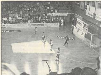
Face à Skopje, une équipe solidaire.