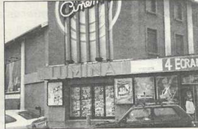
Un cinéma né en 1928, flambant neuf.

Spacieux, le hall d'entrée comprenant un bar permet aux gens de se regrouper, commenter, discuter et de découvrir un ancien projecteur 35 mm. Pour les séances, 1000 fauteuils répartis en quatre salles de tailles différentes mettent le public dans les meilleures conditions pour admirer des écrans panoramiques concaves et profiter du son en dolby SR surround (et son numérique pour la grande salle). «On a eu la grande chance d'inaugurer l'écran géant de cette salle