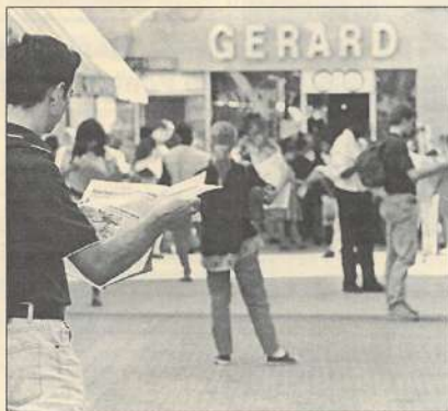
Une expo qui donne une image multiforme de la danse.

C'est dans ce cadre qu'il entend affirmer et développer sa mission de centre ressource documentaire dans le domaine de la danse. L'objectif est donc de fournir les clés pour pénétrer et mieux maîtriser un langage, une technique, une esthétique, qui paraissent encore trop souvent fermés au public. Des livres, des documents professionnels, des vidéos seront ainsi mis à la disposition du public, qui pourra, s'il le souhaite, être aidé, guidé dans ses recherches par le personnel du centre. Ce centre ressource s'adressera à