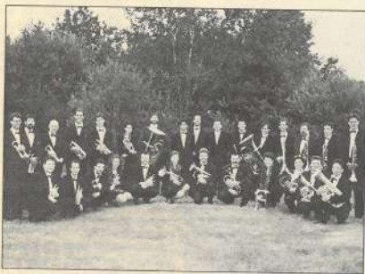
Le Brass Band Val de Loire. 5 décembre à Gray.

Dans ce programme, on notera également le concert de l'orchestre de jazz de la Haute-Saône, organisé le 6 décembre par la commune de Haute-