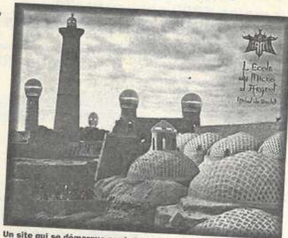
Un site qui se démarque par la beauté du graphisme.

nelle s'en ressent. Quelques remarques cependant à faire. Manquent à l'appel une page sur la lutte contre un certain parti raciste - en effet IAM conteste haut et fort les thèses de ces gens - ainsi qu'une meilleure mise à jour du site. La présentation du site est axée sur le dernier disque, «L'École du micro d'argent», mais un album du groupe devrait reprendre bientôt le flambeau d'une lignée de disque qui a enflammé plus d'une paire d'oreilles. Le rap, culture de la rue, n'a pas de conservatoire. On se forme en écoutant les grandes voix du hip hop, en faisant des improvisations verbales (free styles) sur des beats. A Besançon des passionnés de hip hop se lan-