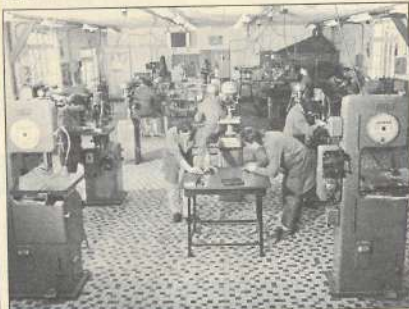
Un aménagement du poste de travail permet à la personne handicapée d'exercer un métier ou de suivre une formation ouverte à tous.

● INTERNET - Retrouvez et découvrez le CIFP et ses différents services sur Internet http://www.cifp-oref.org Dès la fin de l'année figureront également les actions de formation qualifiantes financées par l'Etat - Ministère de l'emploi et de la solidarité - et le Conseil régional de Franche-Comté. La recherche pourra s'effectuer à partir de domaine de formation mais également par métier plus proche du langage courant. L'objectif est de donner aux internautes une première information, rapide et concrète, sur ces stages, et de leur permettre de contacter les organismes de formation par Email ou en se connectant sur leur site.