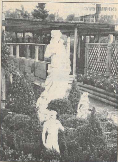
La Franche-Comté compte une centaine d'entreprises en horticulture.