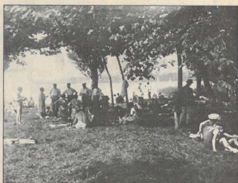
Une des photos d'Edouard Payot.

Le principal des Rencontres se tient au fort Chaudanne, qui réunit les expositions des photographes individuels et des clubs, mais elles se répartissent également dans 5 autres lieux associés à la manifestation : le fort Beauregard, la galerie «D'un bout à l'autre» de Pouilly-les-