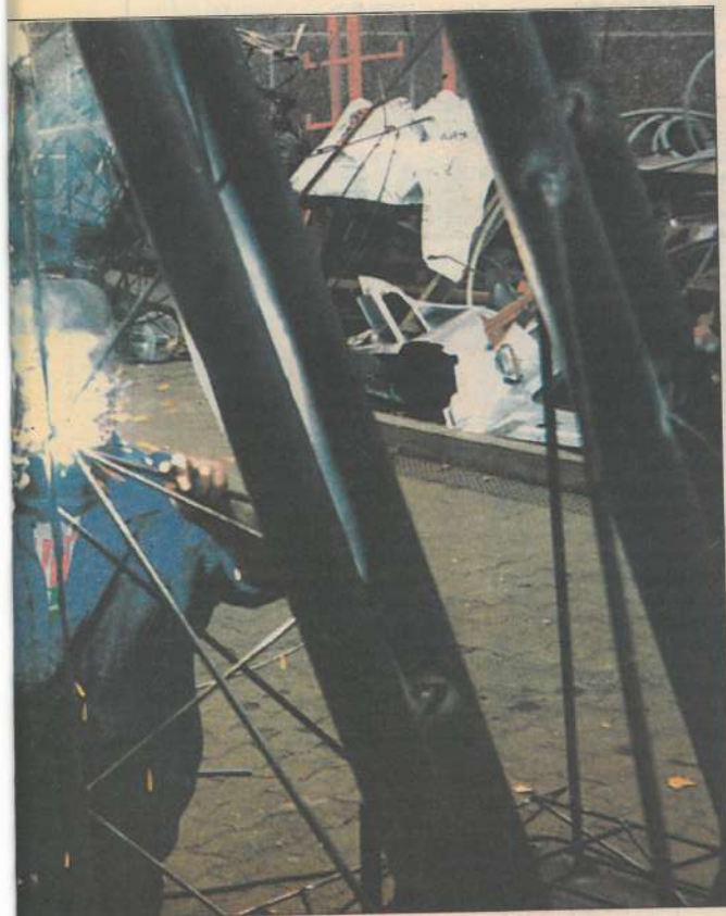
La Compagnie des Bains-Douches à Montbéliard. Une association qui n'est pas intermédiaire - les personnes qu'elle embauche travaillent pour elle -, ce qui ne l'empêche pas de travailler dans l'insertion.