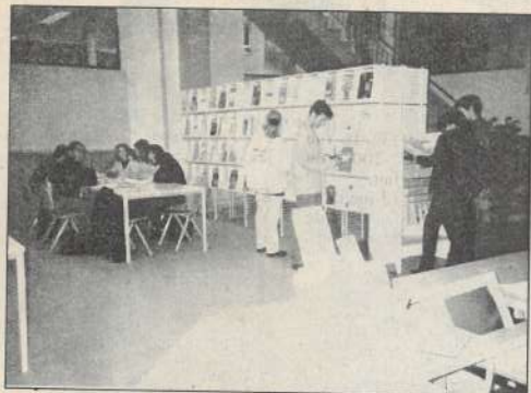
Un nouvel outil pour les étudiants belfortains.

Deux salles de travail seront réservées aux travaux en groupes. Les usagers pourront avoir accès aux supports audio-