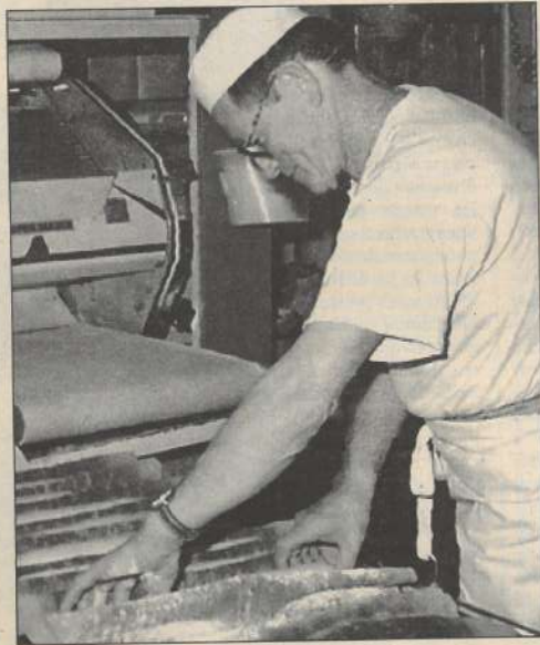
Les entreprises artisanales sont celles qui, en production et fabrication, comptent 1 à 10 salariés.

Cette politique de développement passe aussi par ceux qui veulent se lancer dans le rôle de chef d'entreprise. Bien que la mise en route ne soit pas de tout repos, et peut-être pour cette raison, ils peuvent trouver conseils et suivi : pour les créations à proprement parler, une structure nommée DJER à la chambre