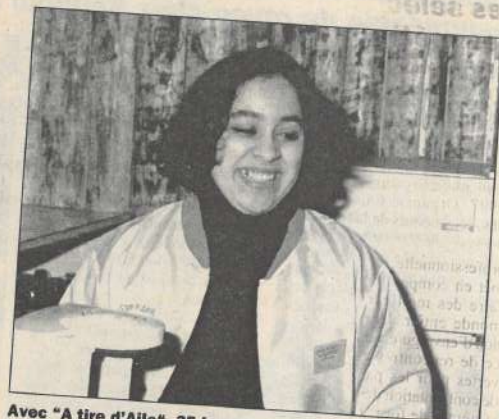
Avec «A tire d'Aile», 35 jeunes ont participé au salon de la jeunesse.

sites bisontins, qui à des travaux de maintenance de la CTB, qui au nettoyage des rives du Doubs. Auparavant dans l'année, d'autres avaient apporté leur aide au Téléthon ou au Salon de la Jeunesse. Pour l'ensemble de l'année, la Ville estime à 250 à 300 le nombre de jeunes qui y auront participé. L'idée initiale du dispositif était de favoriser la réalisation de projets de vacances des 16-25 ans, en évitant d'abord l'assistantat et en introduisant le principe de l'échange, c'est-à-dire une aide contre la participation à une action d'utilité sociale. Critères de ces actions : durée courte, simples mais non dévalorisantes, présentant un intérêt éducatif et n'empiétant pas sur le secteur de l'insertion. Les chèques remis en échange peuvent être dépensés dans les endroits agréés et sont souvent assortis d'une réduction (par