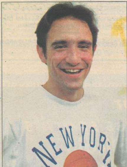
«Le plus rébarbatif, c'est de courir après l'argent».

Sur le point d'entamer son quatrième court métrage, il a déjà remporté quelques récompenses. Recette : passion, ténacité.