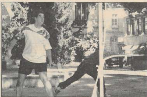
Un sport qui se pratique habituellement en salle.

Mais si, en compétition, la dépense est supérieure à celle du tennis, ce sport peut aussi se pratiquer comme un loisir ; chacun à son rythme. Le Volant bisontin par exemple, champion de Franche-Comté de régionale 1 en 94 et 95, compte dans ses rangs une trentaine de compétiteurs, mais reste surtout un club