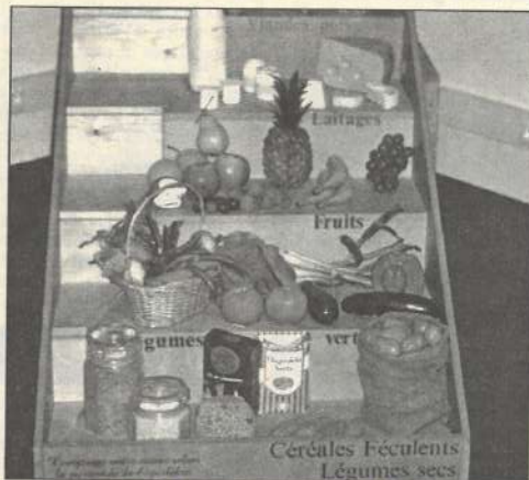
L'exposition actuelle, «Qu'est-ce qu'on mange ?»

Un public de tous les âges puisque le Pavillon des sciences s'adresse aux enfants dès 4 ans par l'intermédiaire d'une animation appelée l'île de la Découverte : dans un décor soigné, par groupes de 15, les enfants vont d'un bateau amarré à une forêt de bambou, d'une mare au trésor d'un pirate pour faire diverses découvertes par l'intermédiaire des cinq sens. Ludique et interactif, ce lieu est à l'image de l'ensemble des expositions de l'espace Galilée. Le public participe, découvre en participant. Ainsi sur l'exposition actuelle «Qu'est-ce qu'on mange ?» : à un endroit, le visiteur constitue un plateau fictif de re-