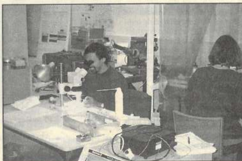
Les thésards sont formés à la recherche par la recherche.