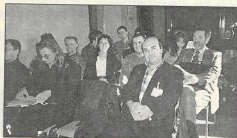
Les Doctoriales 97 avaient réuni une centaine de personnes.