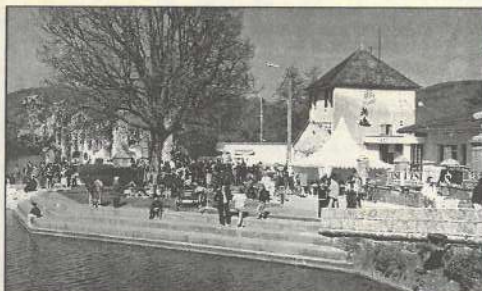
8000 visiteurs l'an dernier. En cas de pluie, un chapiteau sera dressé.

HUIT MILLE participants en une journée : au-delà des espérances des organisateurs, la première édition du salon «sports et loisirs» fut un succès incontestable, le temps s'étant mis de la partie. A l'origine de cette manifestation, l'organisme Cap loisirs a décidé de renouveler l'expérience, en l'étendant à deux journées (17 et 18 avril, du samedi 14 h au dimanche 19 h) et surtout en conservant son originalité : à chaque stand, les visiteurs peuvent essayer une activité de sport ou de loisir. «Nous voulions proposer autre chose que les salons statiques auxquels nous participons régulièrement. Nous l'avons voulu actif pour les visiteurs et en fait ce sont eux qui font le salon». A Quingey, sur le site où Cap loisirs propose toute l'année de multiples activités, ces derniers pourront essayer une vingtaine de disciplines comme le badminton, le boomerang, le canoë, le jeu de go, le modélisme, le tir à l'arc, le trampoline, le VTT ou