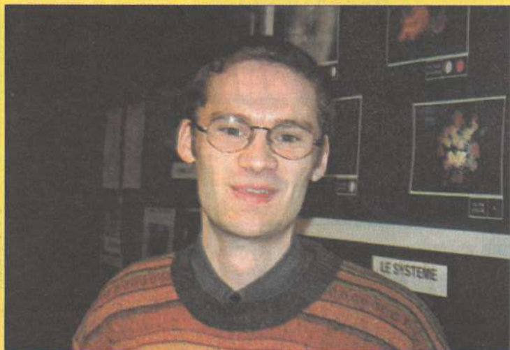
L'invention des filtres Optimax lui a valu un Défi-jeunes en 95.

Ce jeune de Bavilliers a déjà obtenu plusieurs prix pour diverses inventions en tous genres. Rencontre.