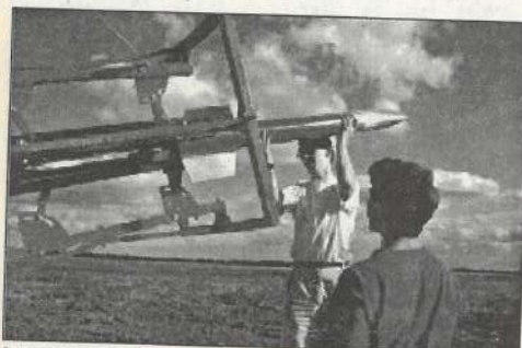
Jeunes travaillant sur une rampe de lancement au camp de micro-fusées de Bourges.

Pour tous ceux qui sont intéressés, le CNES met à dispo-