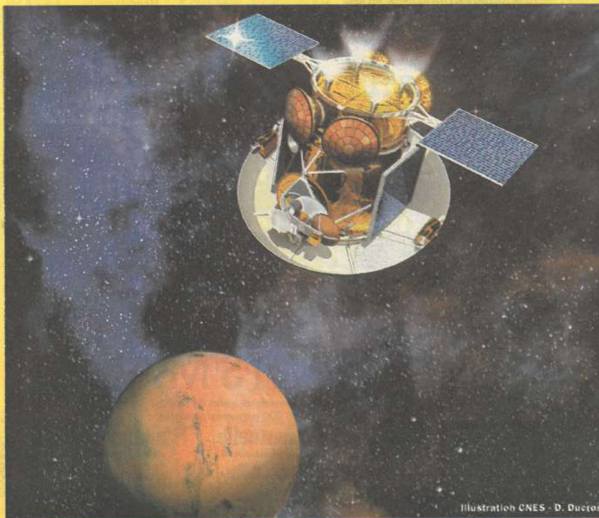
Illustration CNES - D. Ducros

Du 9 avril au 9 mai, le CNES propose à Besançon une exposition sur «les enjeux de l'espace». Diverses animations ont lieu en parallèle. p.12