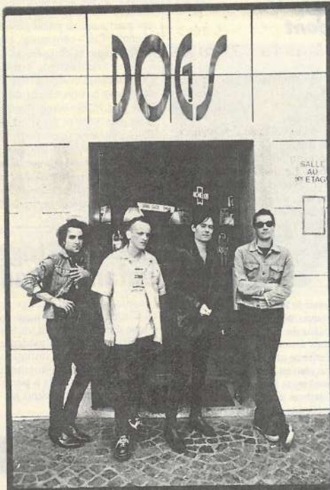
de Dole à Besançon). Renseignements, 03.81.52.49.94. Le 24 avril à l'Atelier des Mômes (Montbéliard), 03.81.30.47.05.

Apparus à Rouen, les Dogs ont donné leur premier concert en 1973, une époque abandonnée aux solos étirés, gras et nauséux. Depuis, ils ont traversé les époques sans changer leur rock direct et mélodique, basé sur la formule classique voix, guitare, basse, batterie et sur des chansons de facture non moins classique mais souvent accrocheuses (format court, couplet, refrain...). Leur premier album est sorti en 79, époque abandonnée aux guitares rabougries des punks. Vingt ans plus tard, alors que règnent techno et hip-hop et que Wilko Johnson n'évoque plus rien à personne, ils sont toujours là, avec des disques toujours aussi bons («4 of a kind» est le dernier) et un petit changement : l'anglais chanté avec un accent épouvantable aux débuts s'est quand même légèrement amélioré. Ces Dogs ne semblent pas près de lâcher le morceau. Le 30 mars au Cousty bar (21, rue